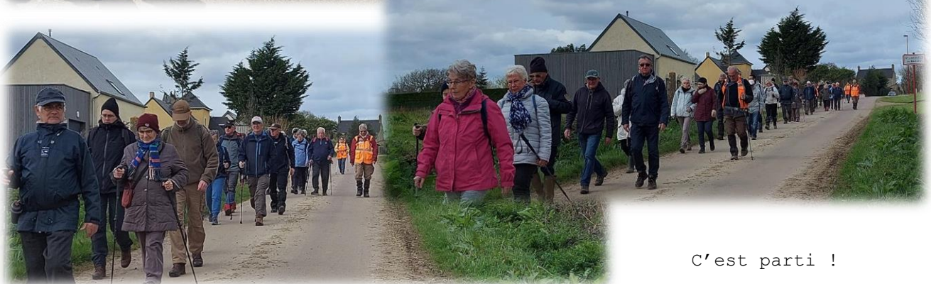
C'est parti !