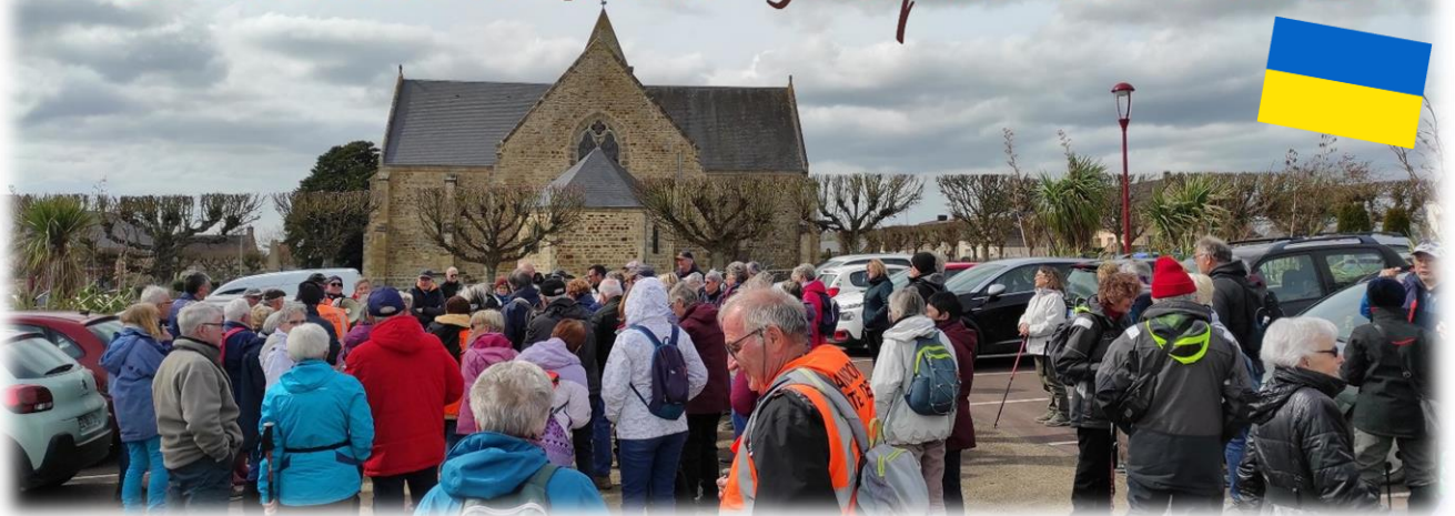
Rendez-vous parking de l'église