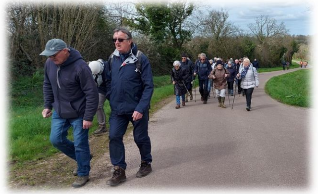
Route de Saint-Jean