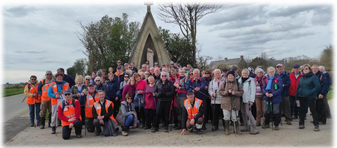
Photo de groupe devant l'oratoire de la Vierge à l'Enfant.

Le village de Saint Jacques de Néhou est tout proche, mais avons une grande boucle à faire avant d'y arriver !