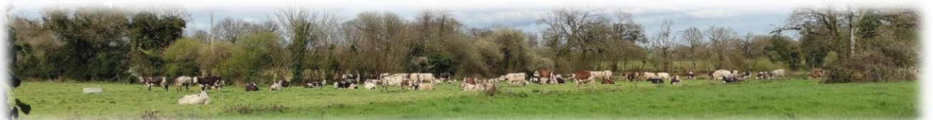
Beau troupeau de vaches normandes