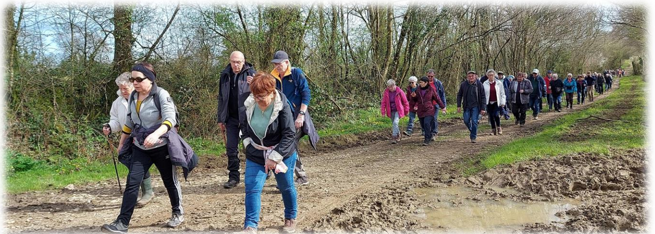
En passant non loin du lieu-dit La Barrière du Lude et du manoir du Petit Lude (XVe), défense avancée du château de Néhou qui a complètement disparu