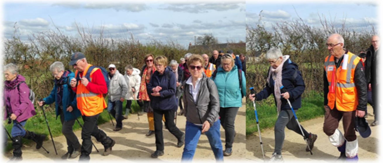
Marchons, marchons d'un bon pas