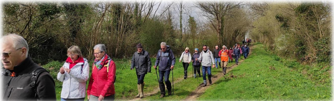
Ouah, ça fait du monde !