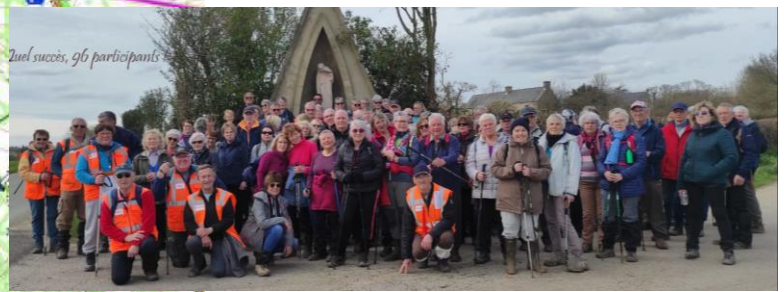
96 participants, ça fait du monde !