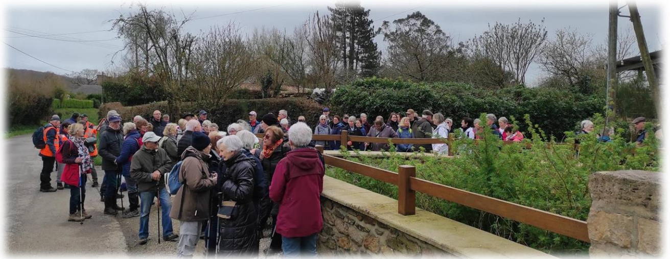
Déjà la séparation