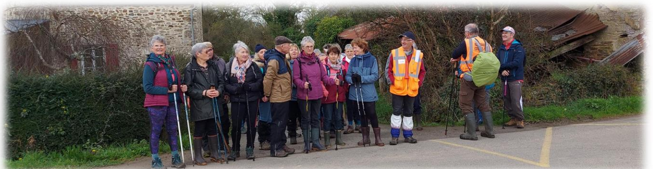
Prudence, traversée de la D115