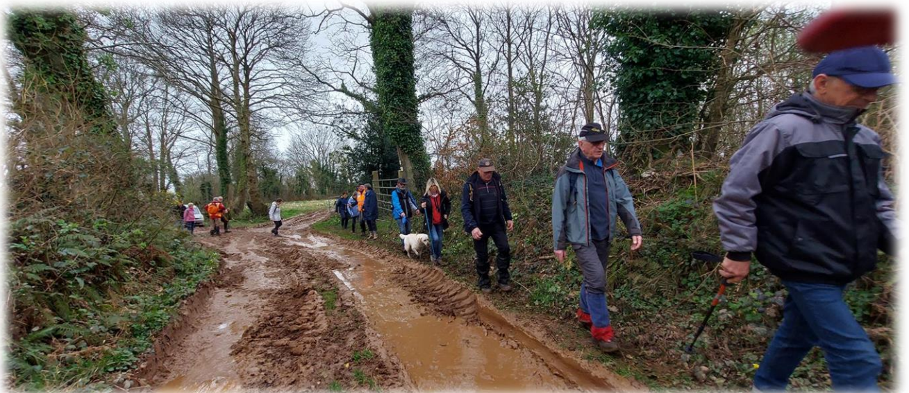
Nous aurions pu donner un coup de main aux bucherons entrain d'abattre des arbres, la tempête Ciaram est aussi passée par là.