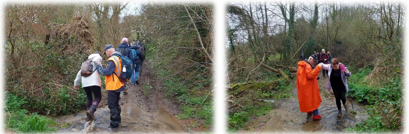
Les frères Mouchel sont très galants !

Traversée à gué d'un petit ruisseau, une branche du ruisseau Querbot prenant sa source tout près d'ici. Le Querbot qui prend sa source principale au Theil traverse sur toute la longueur du parc animalier.