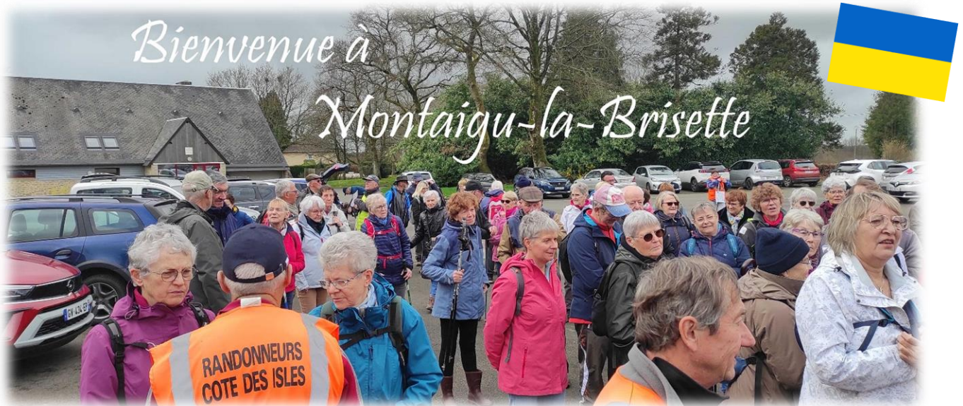
Rendez-vous grand parking de la salle communale