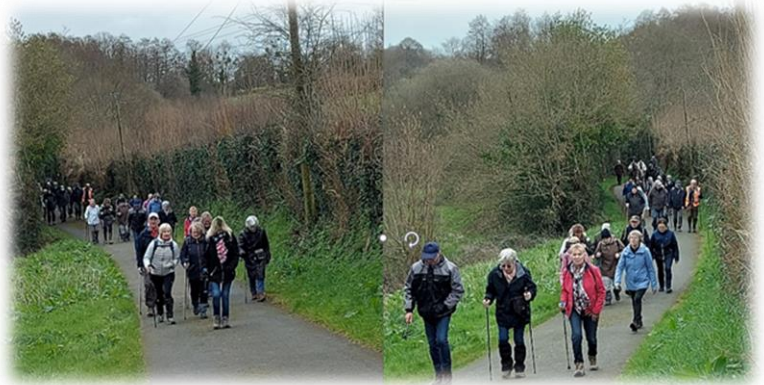
En passant par les Vieilles Maisons