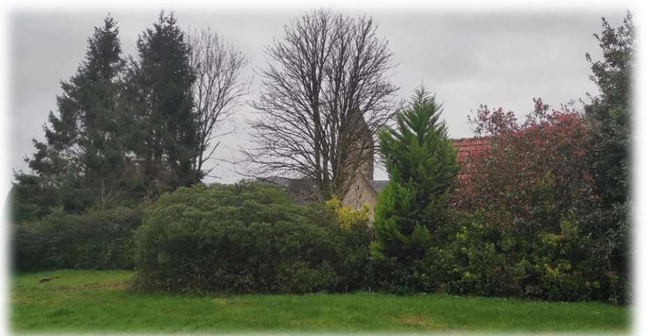
Ouf, nous arrivons au sommet de la colline où est construite l'église Saint-Martin de Montaigu-la-Brisette. Elle culmine à 131 mètres d'altitude.