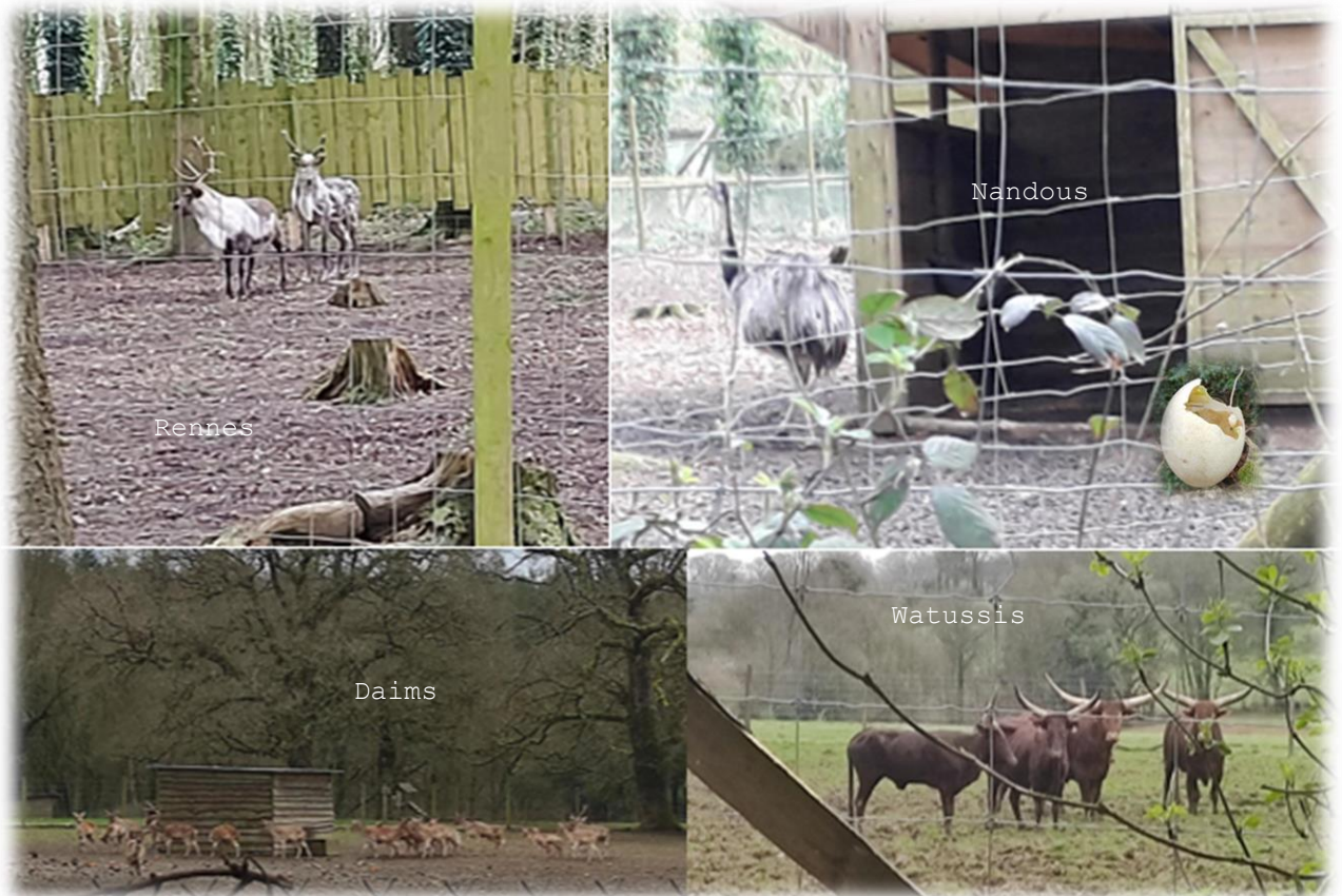
Animaux que nous apercevons le long du chemin

Chameaux ou dromadaires ? Le mot chameau possède deux syllabes, donc deux bosses ! Cha-Meau, deux bosses ! Elles leur sont très utiles. Ils y stockent de la graisse leur permettant de se nourrir et s'abreuver sans rien avaler.