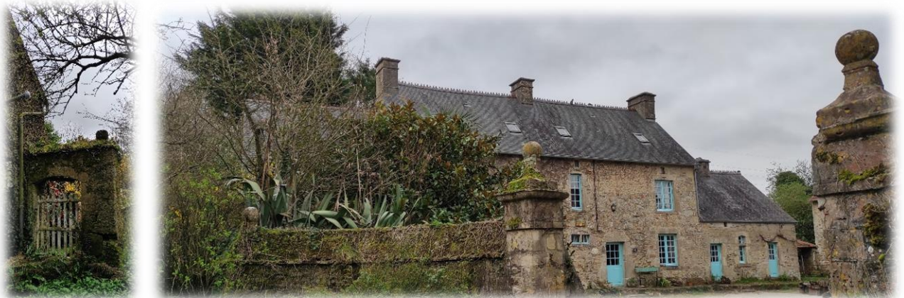
Une ancienne ferme au village les Becquets, où nous croisons une dame nous disant qu'elle y a travaillé. Les propriétaires partagent leur temps entre leur domicile à la Rochelle et cette « résidence secondaire ».