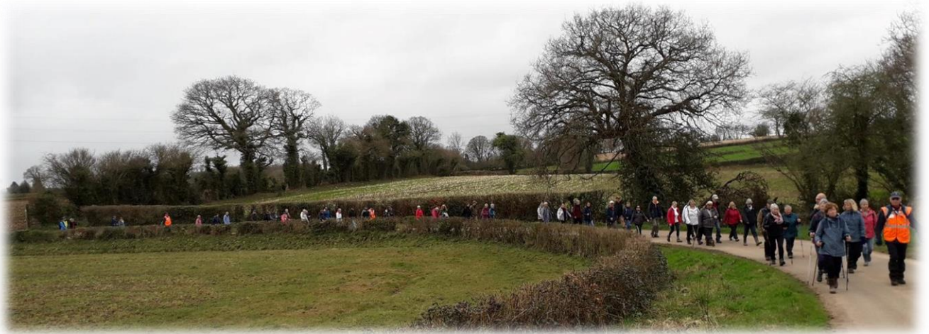
Petite route de campagne