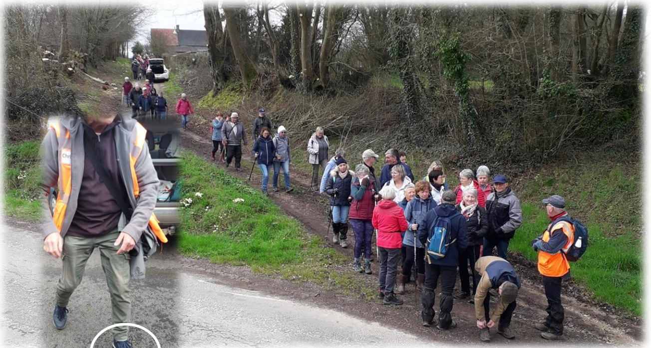
C'est parti, suivez le guide