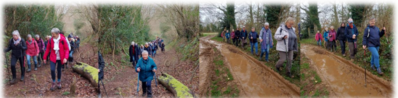
Chemins parfois secs, parfois très humides

Traversée à gué d'un petit ruisseau, une branche du ruisseau Querbot prenant sa source tout près d'ici. Le Querbot qui prend sa source principale au Theil traverse sur toute la longueur du parc animalier.