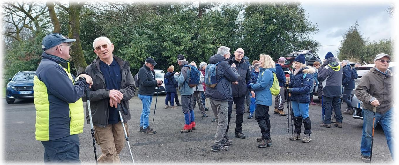
Ça discute pas mal en attendant le départ !