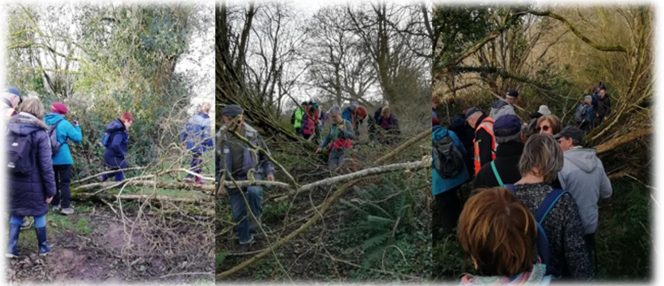
Un peu plus loin des embâcles moins importants