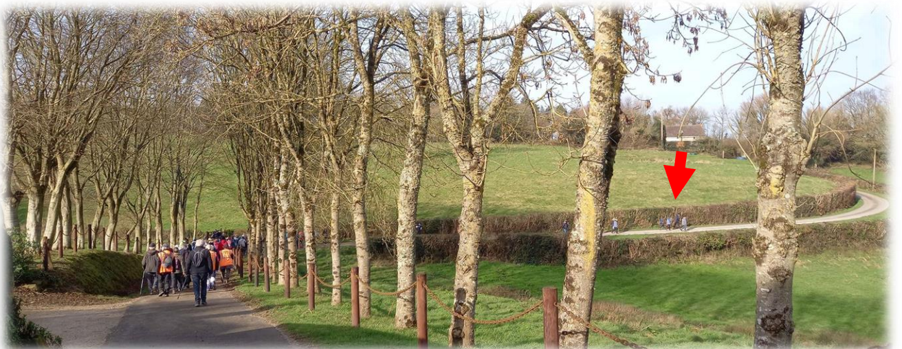
Puis plongeon dans le Val fontaine. Comme il y a 6 ans, carton rouge à ceux qui se sont échappés !!!