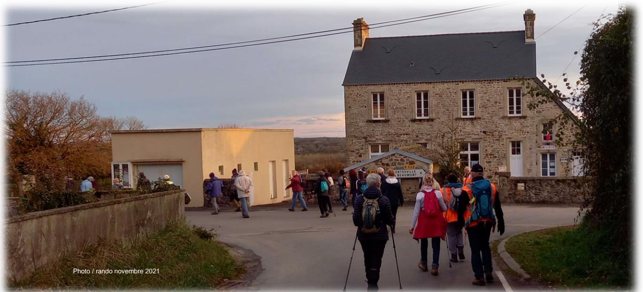
Photo / rando novembre 2021

Après la traversée du hameau Campion, la route du hameau Durel va nous ramener au parking, en passant devant le calvaire.