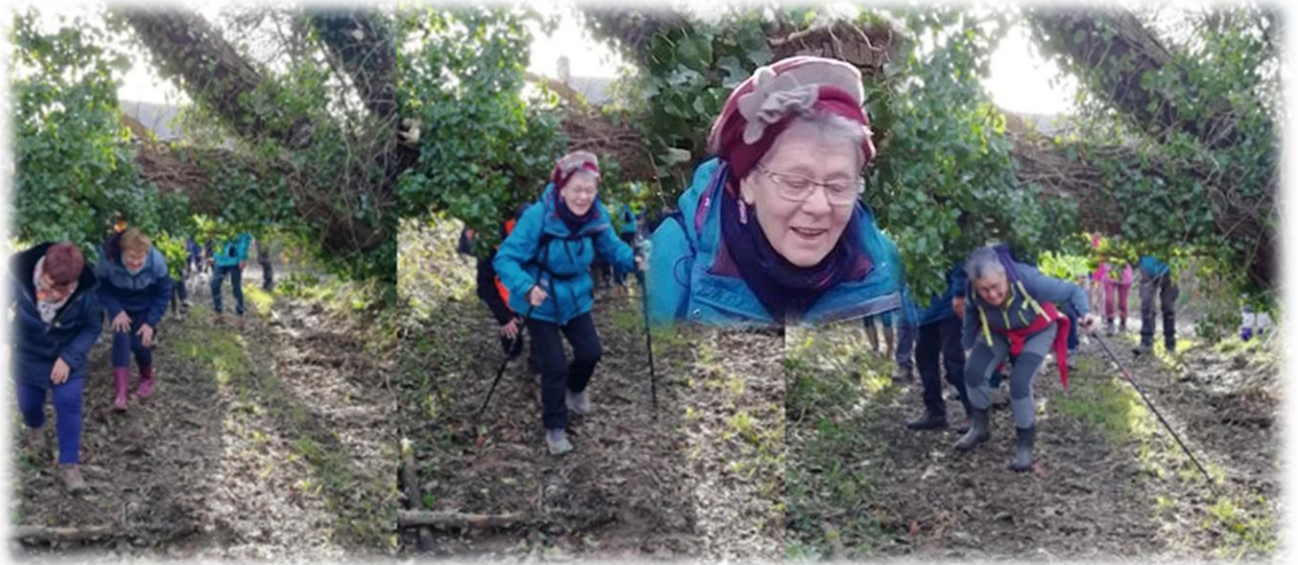
Attention ça décoiffe !