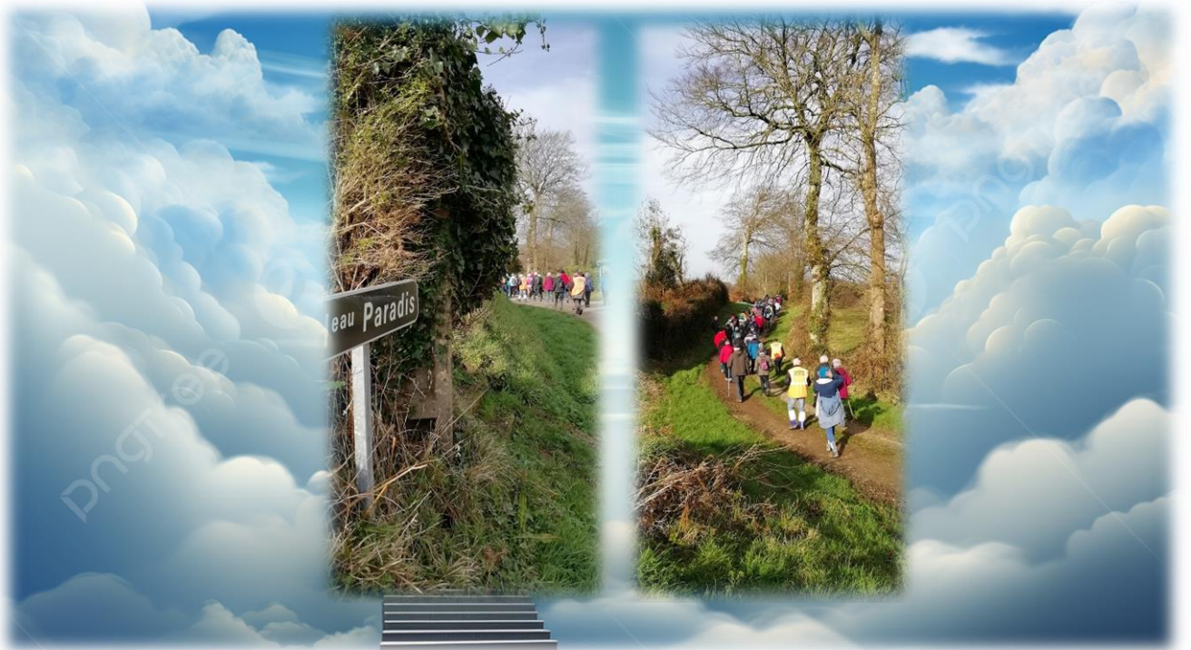
😄 C'est parti pour le Paradis 😄