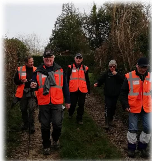
Voilà une arrière-garde imposante !