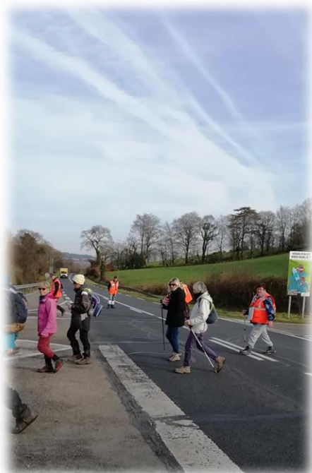
Descente « vertigineuse » vers la D902 (Bricquebec-Carteret) puis traversée