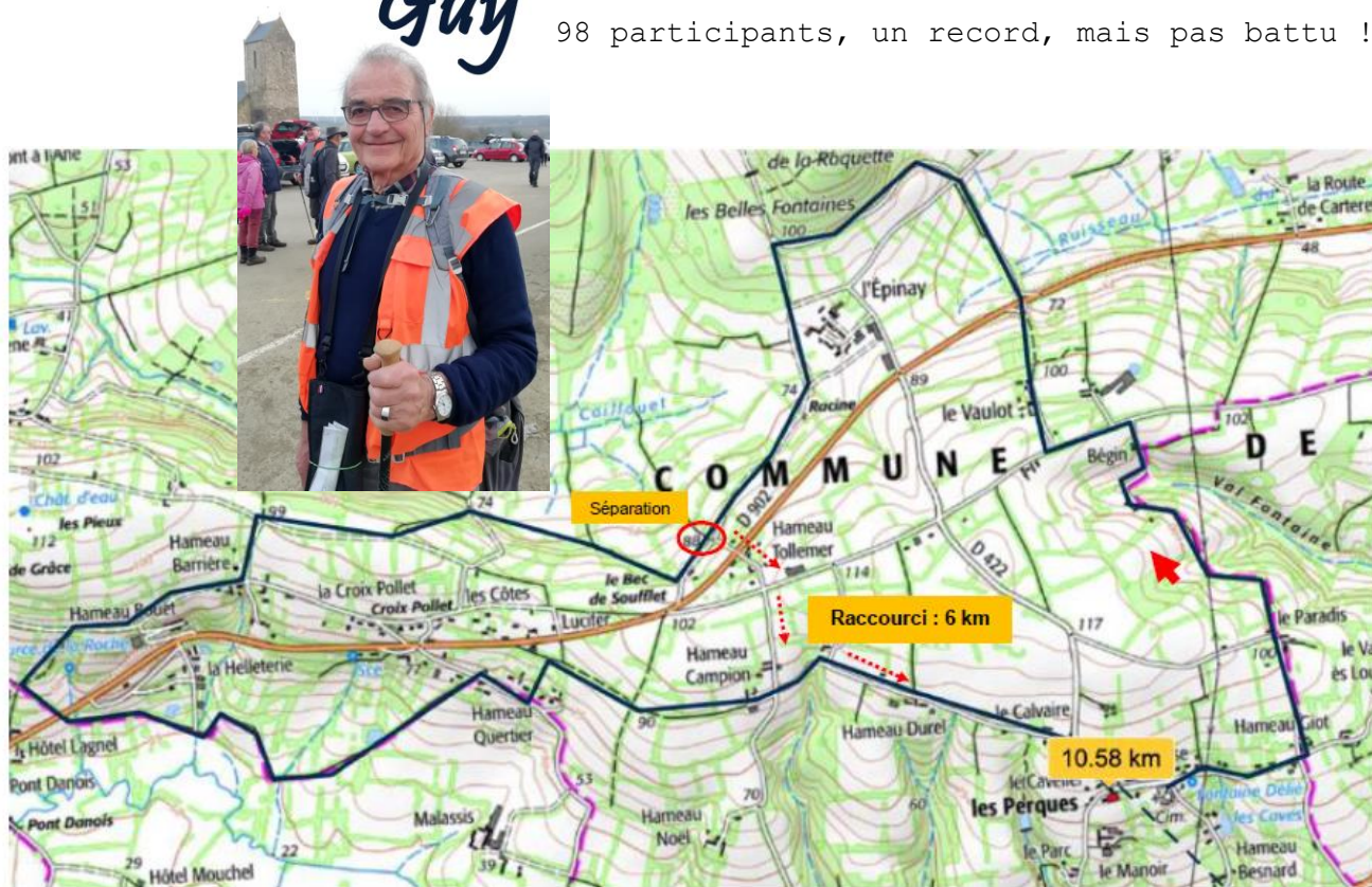
Parcours long : 10,5 km, parcours raccourci 6 km

98 participants, un record, mais pas battu !