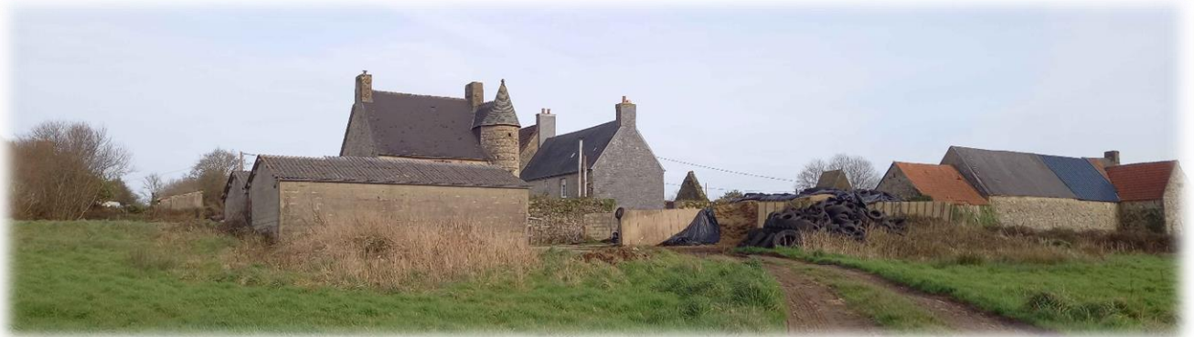
Le manoir de L'Epina y (XVI e )

Chemin en dessous du Bois de la Roquette, menant à la carrière secondaire de l'entreprise CARRIERES LEROUX PHILIPPE. Carrière à priori plus exploitée.