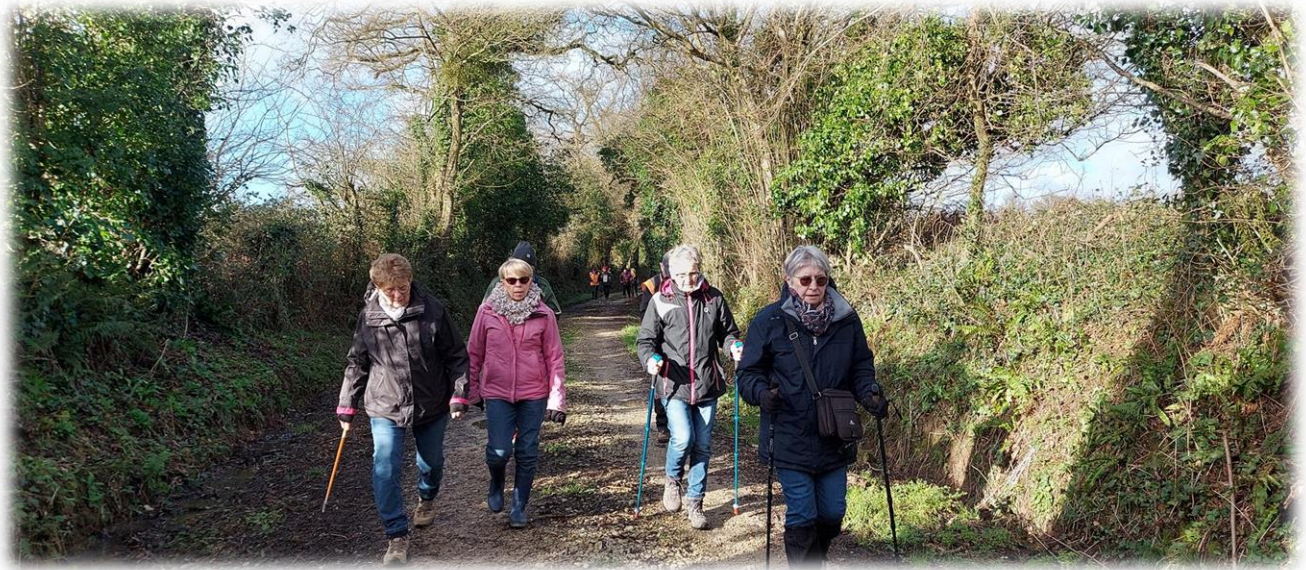
Le soleil est au rendez-vous, mais peut-être pas pour longtemps !