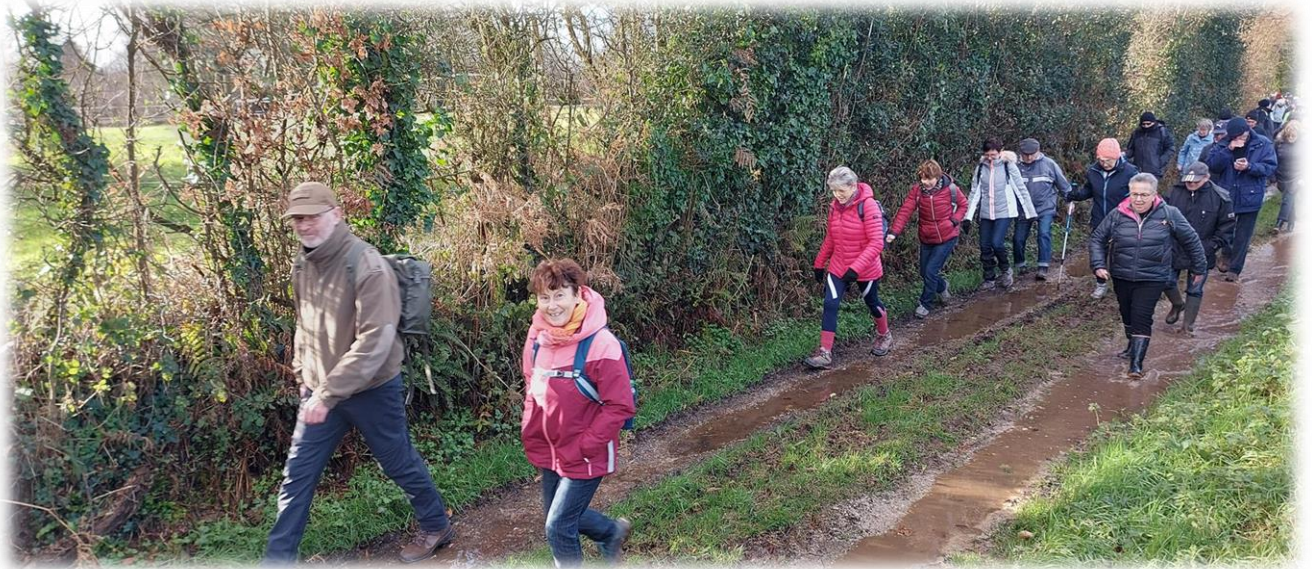
Passage un peu humide, vive les bottes !