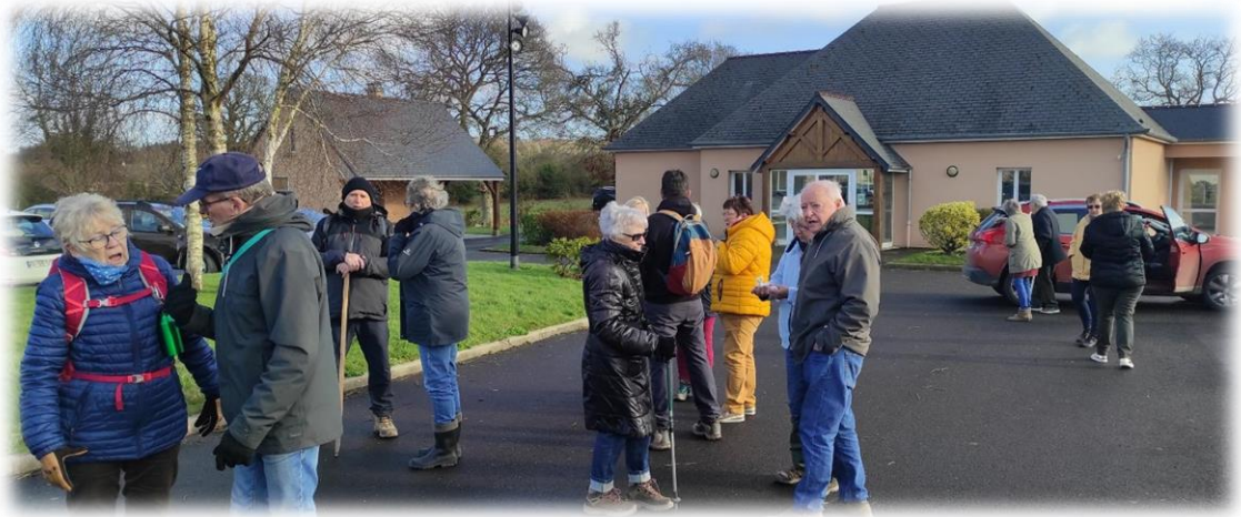
Parking de la belle salle communale