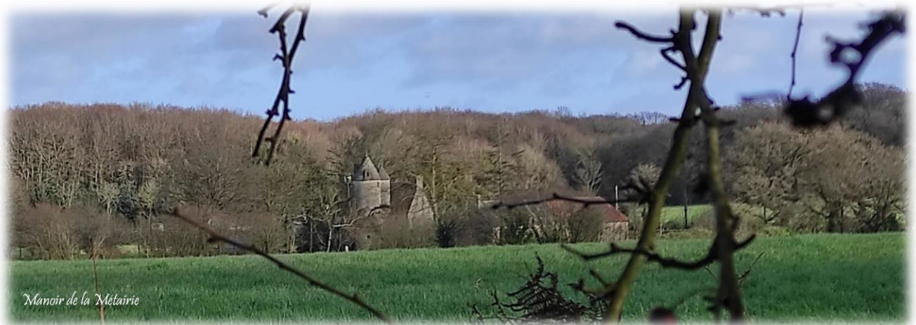
Manoir de la Métairie