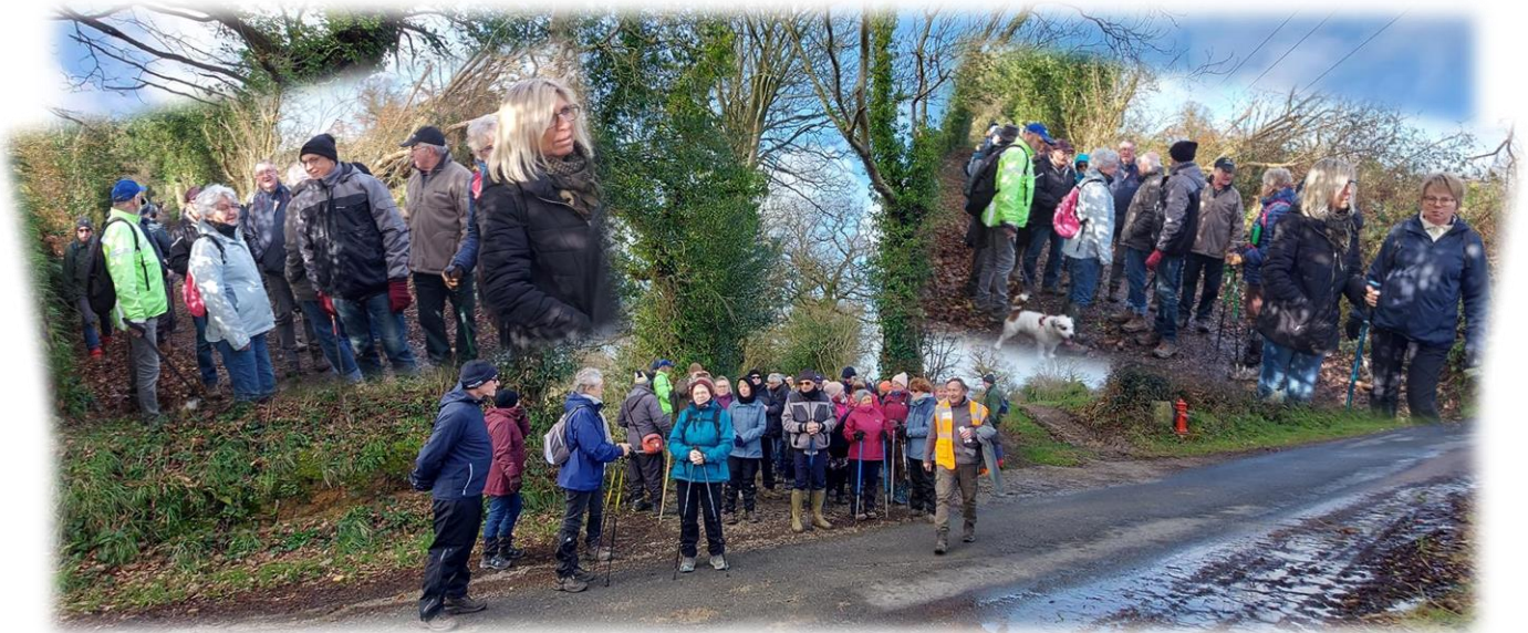
Route d'Hermanville que nous traversons

2 éclaireurs pour vérifier l'état du chemin, les flaques d'eau sont encore gelées !