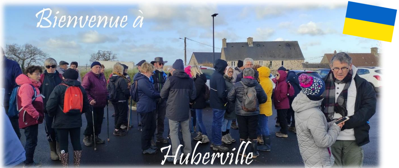
Rendez-vous sur le parking de la salle communale et mairie