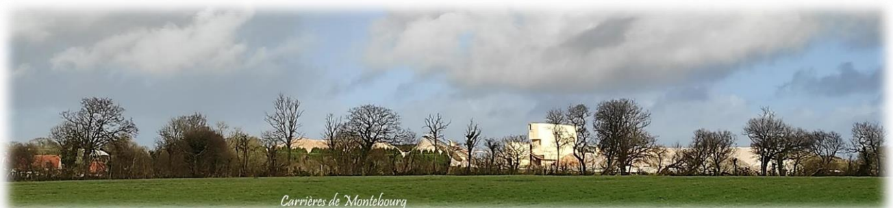
Carrières de Montebourg

Tandis que le gros de la troupe poursuit son chemin vers les Mont d'Huberville. Nous sommes sur le territoire de Saint-Cyr, en limite de celui de Montebourg.