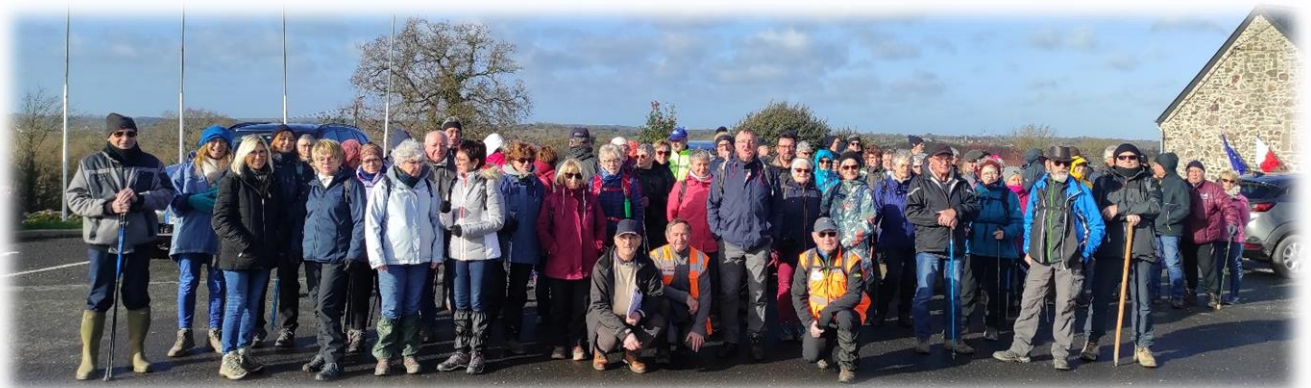
Regroupement sur parking mairie pour la photo de famille ... belle famille !