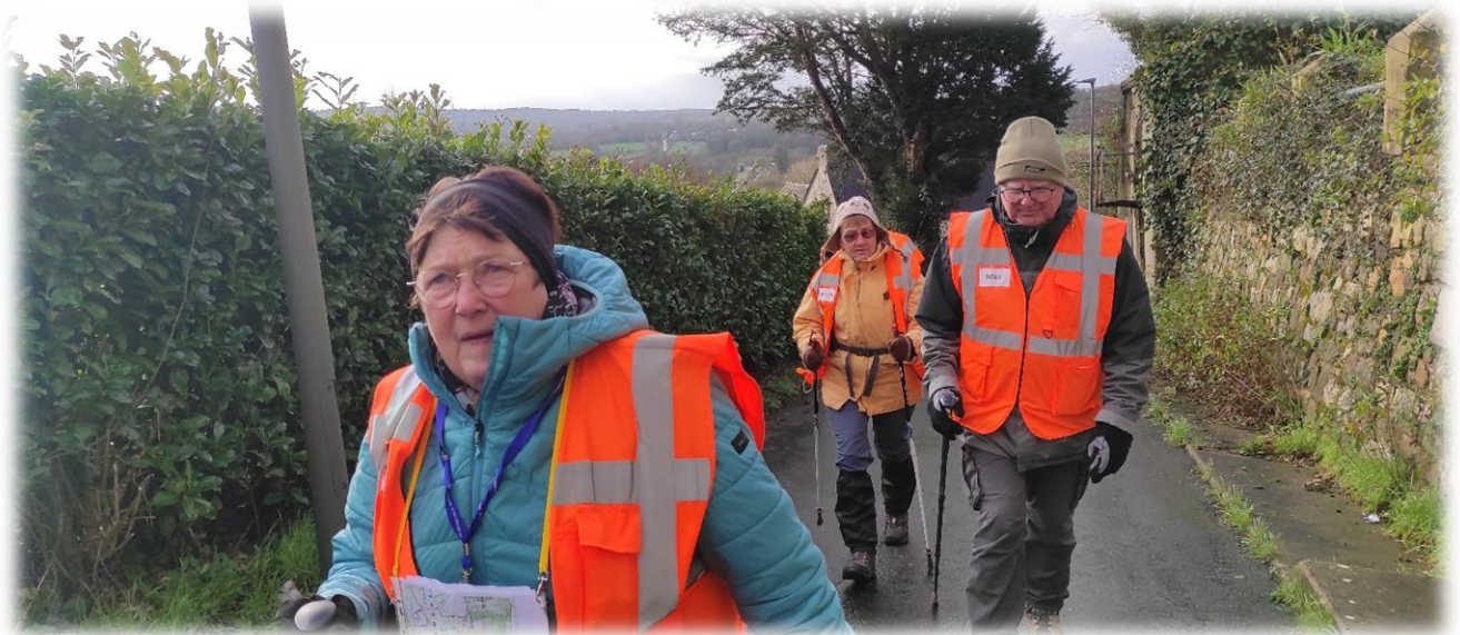
Bigre, dès le départ une bonne grimpette ! Pas de pluie ni neige, mais une bise glaciale