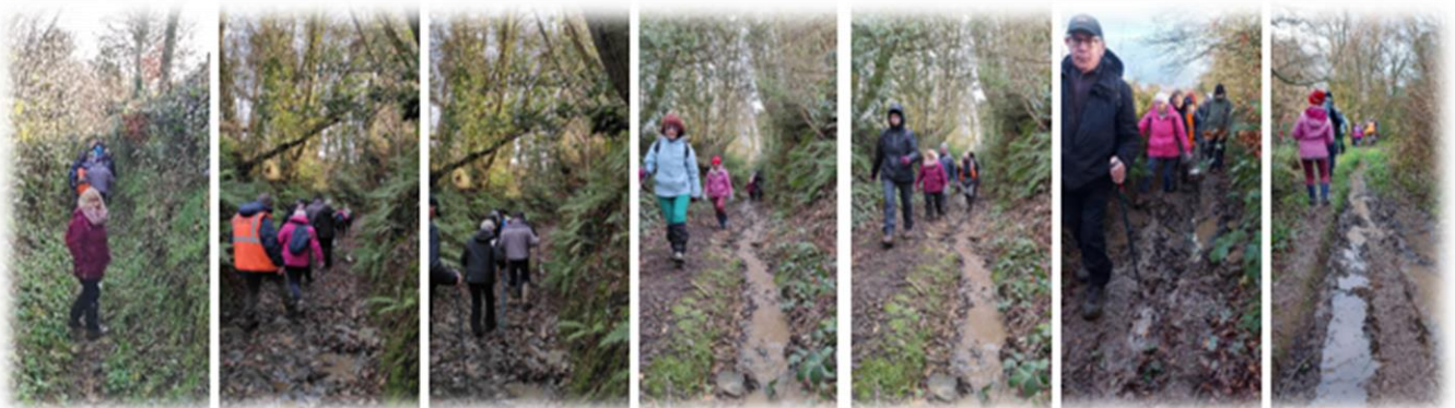
Passage un peu boueux