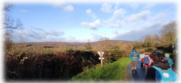
Retrouvons La Hutaine, petite route mitoyenne Le Vrétot / Les Perques