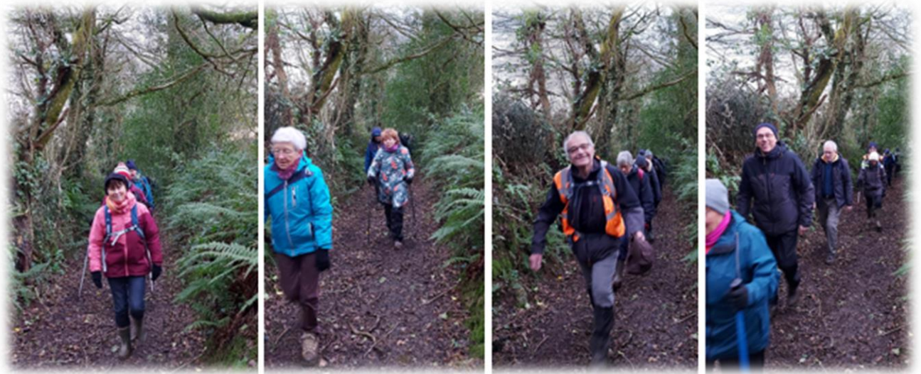
Un chemin bien sympathique