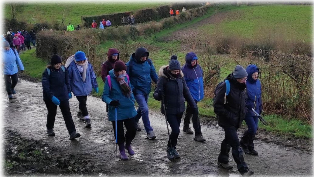
Tout le monde il est bien emmitouflé avec bonnet sur la tête !