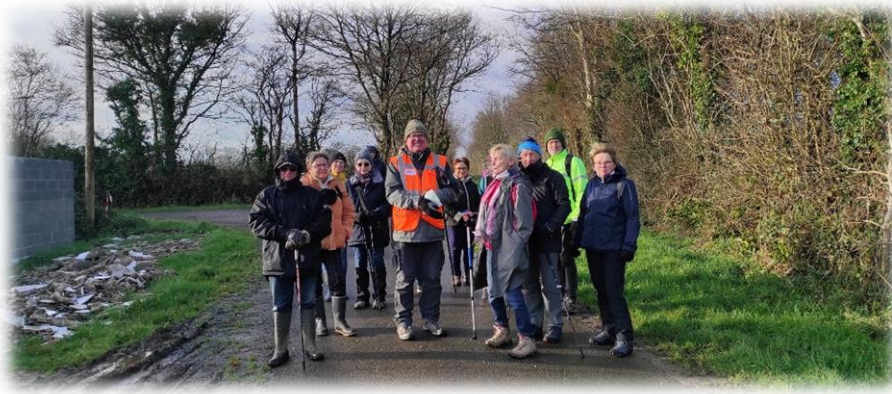
C'est déjà la séparation