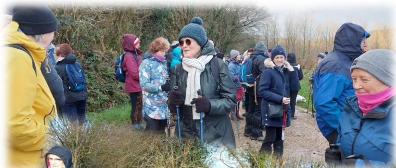
Brr...Il fait froid, marchons dans la bonne humeur