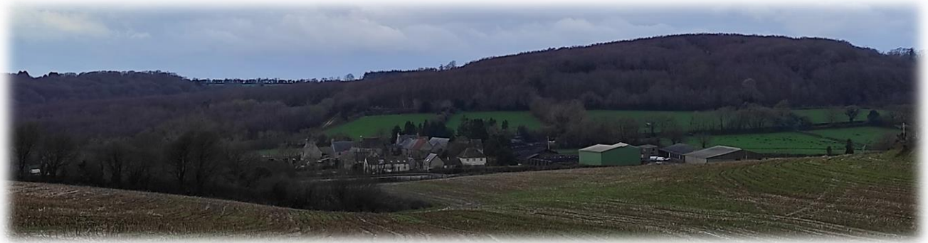
Vue sur le manoir de l'Épinay (Les Perques)