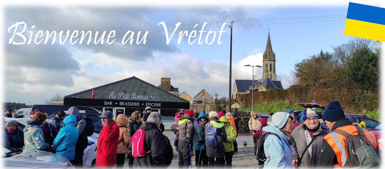
Rendez-vous sur le grand parking