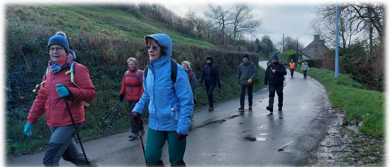
Nous marchons d'un bon pas ... pour nous réchauffer