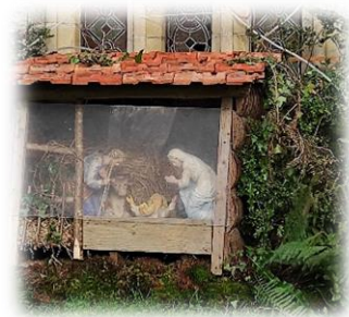
En passant, admirons l'église Notre-Dame des Anges, et son clocher octogonal orné de 4 anges aux 4 coins cardinaux, et la petite crèche.