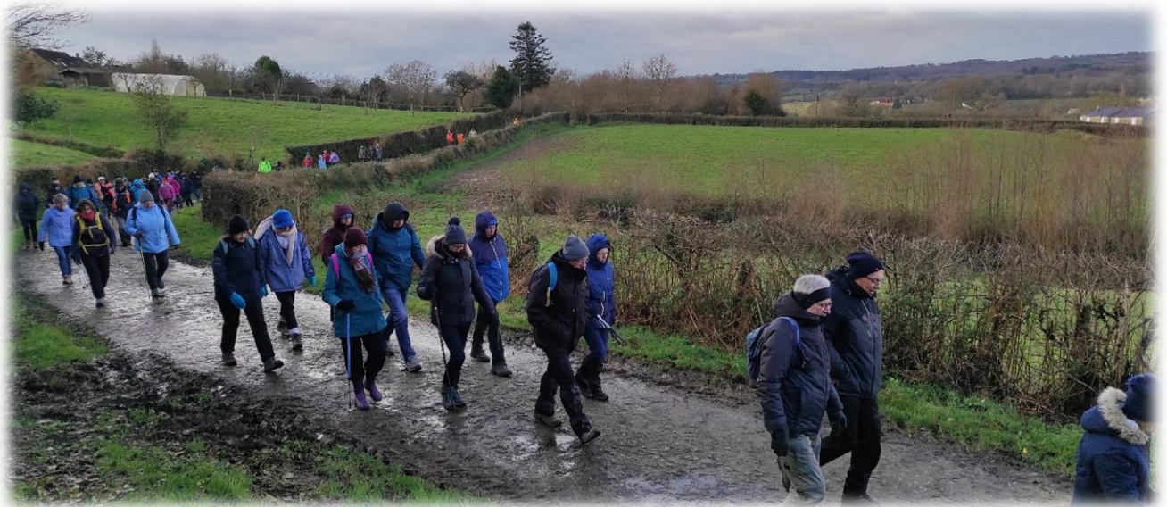
Le groupe s'effiloche