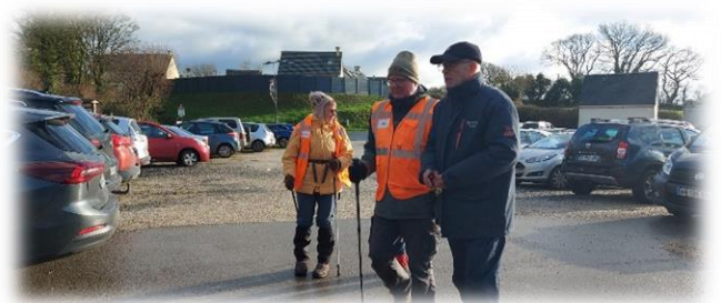
C'est parti ... avec quelques retardataires