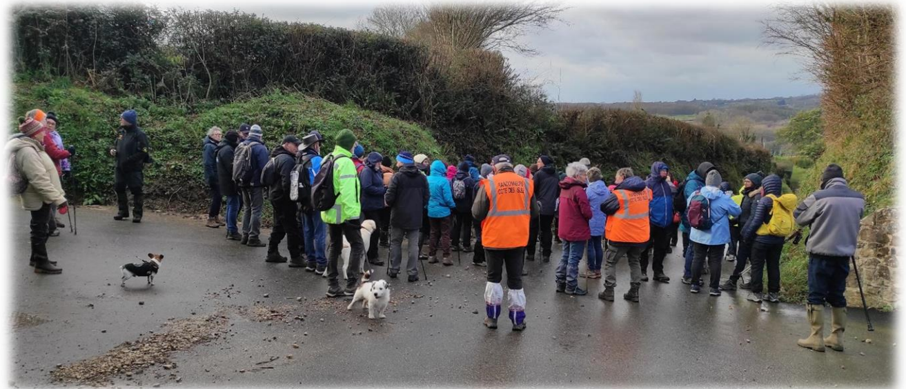
Une pause bien méritée