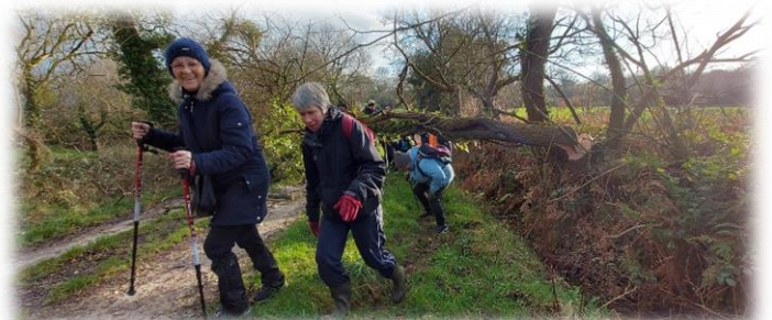
Beau chemin carrossable, mais un arbre fraîchement abattu nous barre la route. L'agriculteur tombé en panne d'essence, surpris de voir tant de monde !!!