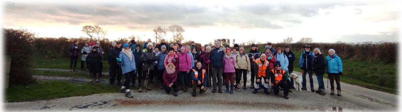
Il n'est jamais trop tard pour faire la photo de groupe !