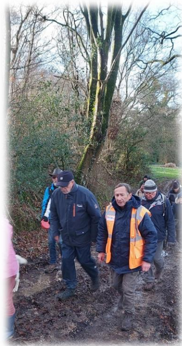
Quelques passages humides