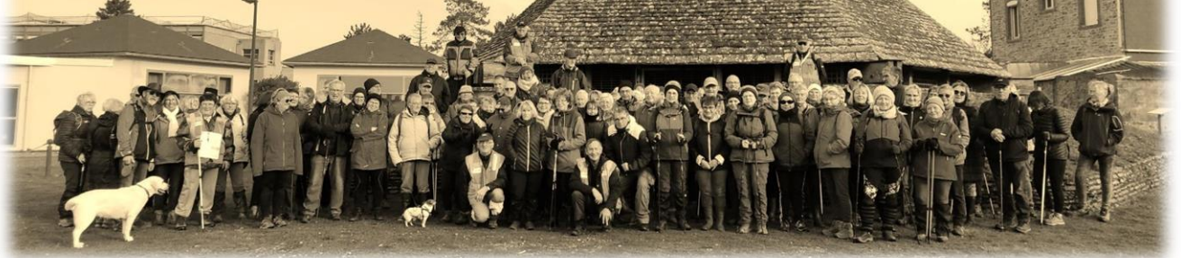
Fin de la balade