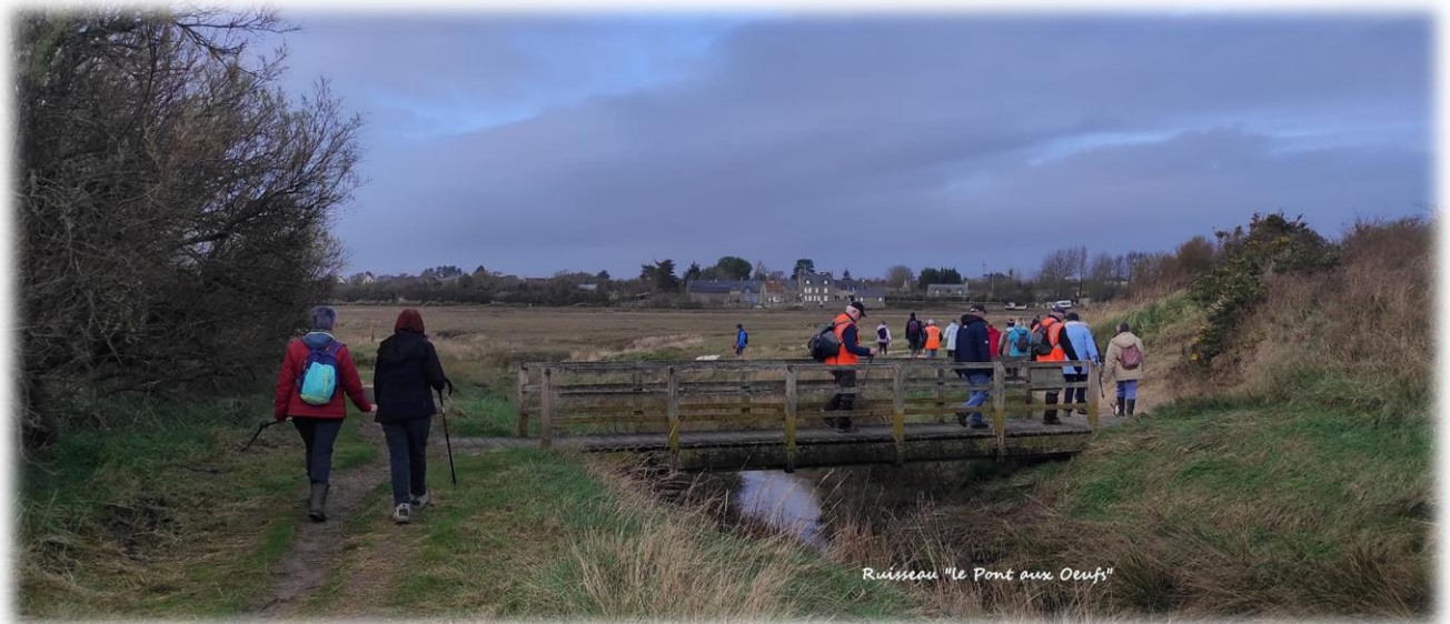
Passerelle sur le ruisseau ''Le Pont aux Oeufs''