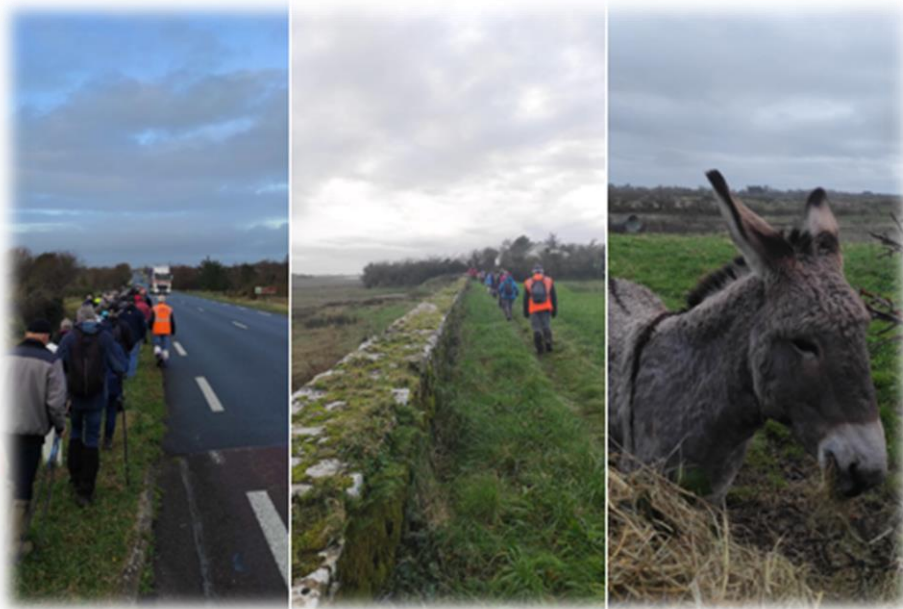
Sur le chemin du retour ... hello mister âne