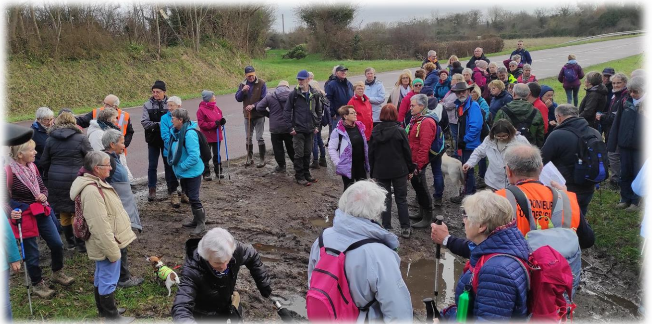
Après une courte escapade dans les dunes de Lindberg, retour sur la D650