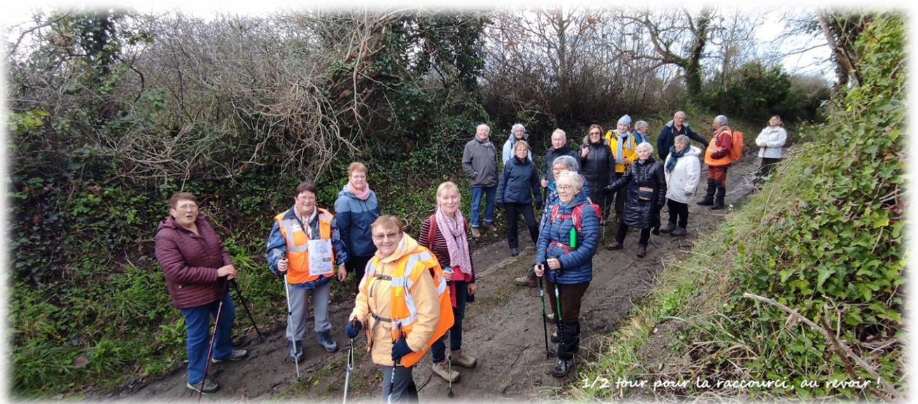
Le groupe raccourci n'ira pas plus loin, demi-tour