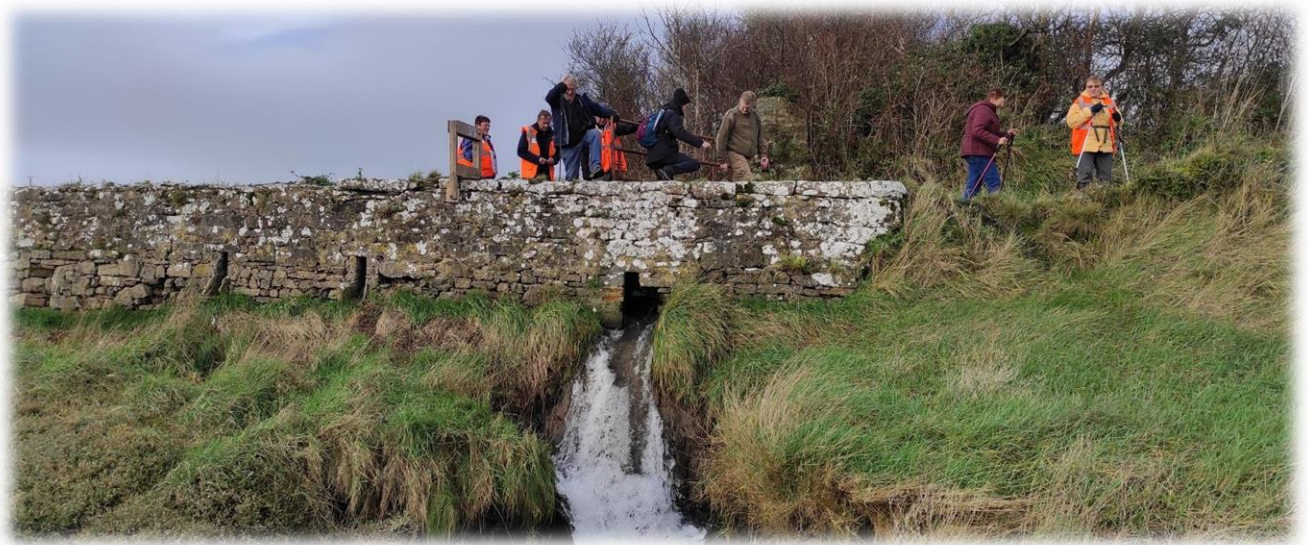
ce champ, nous obligeant à un peu d'acrobatie ... même pas le vertige !