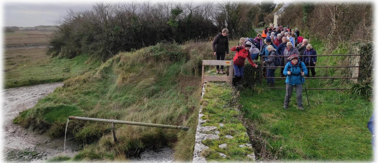
Pour rejoindre les dunes de Lindbergh, contournement du havre par