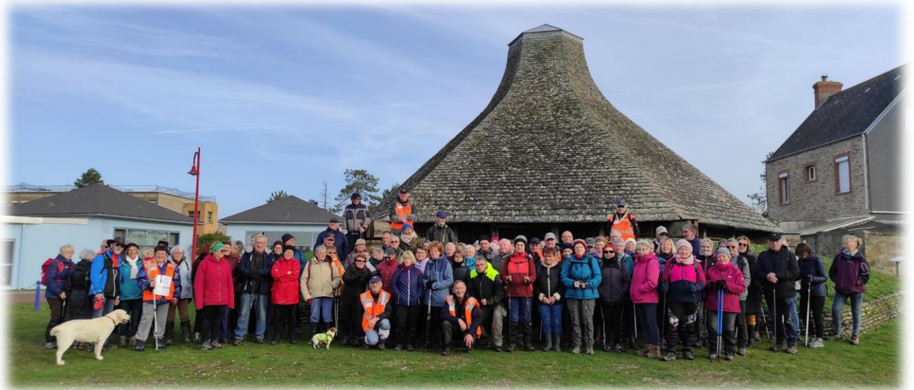
Photo de famille devant le baptistère paléochrétien de l'époque gallo-romaine. Le baptême par immersion y était vraisemblablement pratiqué. Etant fermé, nous ne pouvons pas découvrir l'ingénieux système d'adduction d'eau.

L'église Notre-Dame qui se distingue par son clocher fortifié couronné de créneaux et de mâchicoulis du XI e siècle, vestige de la guerre de Cent Ans.