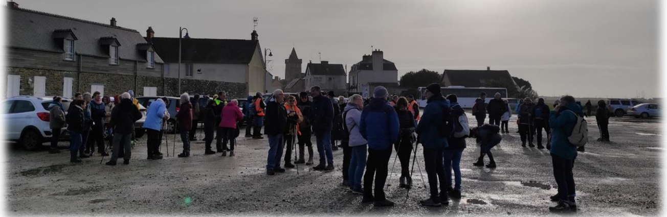
Rendez-vous parking du Havre.