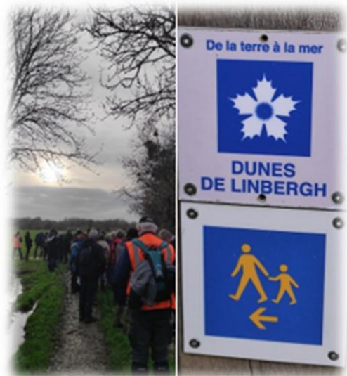
A la découverte des dunes de Lindberg, mais pas d'avion en vue, ah si un hélicoptère à notre départ !