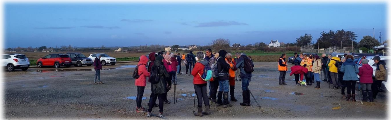
Après la grisaille, retour à un temps plus clément, le ciel s'est dégagé pour laisser apparaître le soleil cet après-midi, youpi !