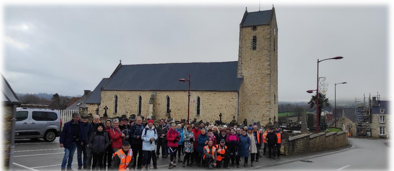
Photo de famille (55 participants) devant l'église Saint-Barthélémy (XVII e -XVIII e ) Dans sa forme actuelle, avec son clocher-porche de plan carré, elle date du XVIII e siècle. En jetant un coup d'œil par-dessus le mur on constate un cimetière superbement entretenu.