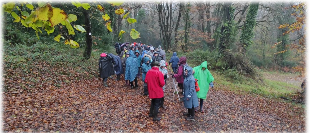
Ah zut, la pluie est au rendez-vous, à nos ponchos !