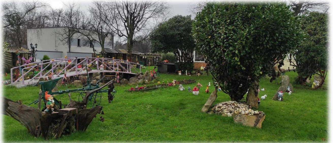
Là-haut sur la D112, juste avant de tourner à droite en direction de la Basse Cosnière, un jardin joliment décoré et animé avec une multitude de figurines.