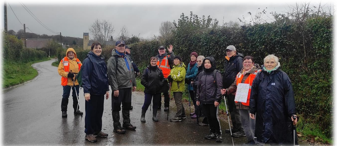
Hameau Langlois, c'est l'heure de la séparation, l'église est en vue, nous ne sommes pas loin du parking.