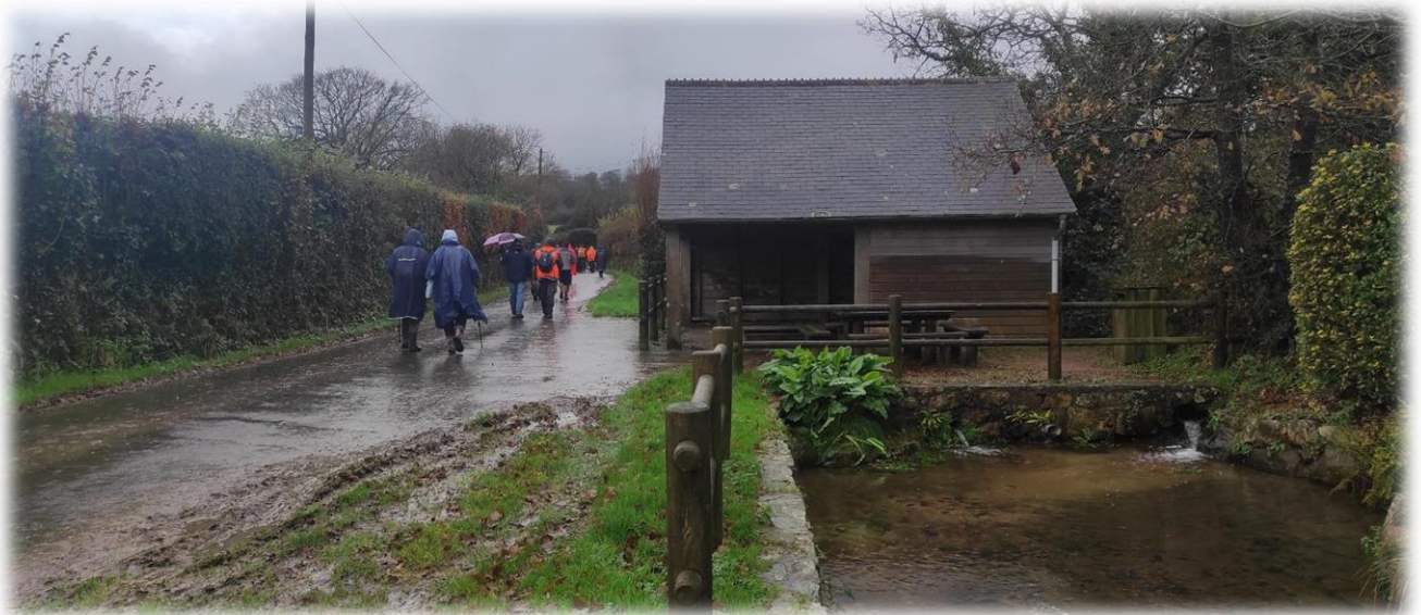
Lavoir du hameau Clair Douet. Il pleut, il pleut ...