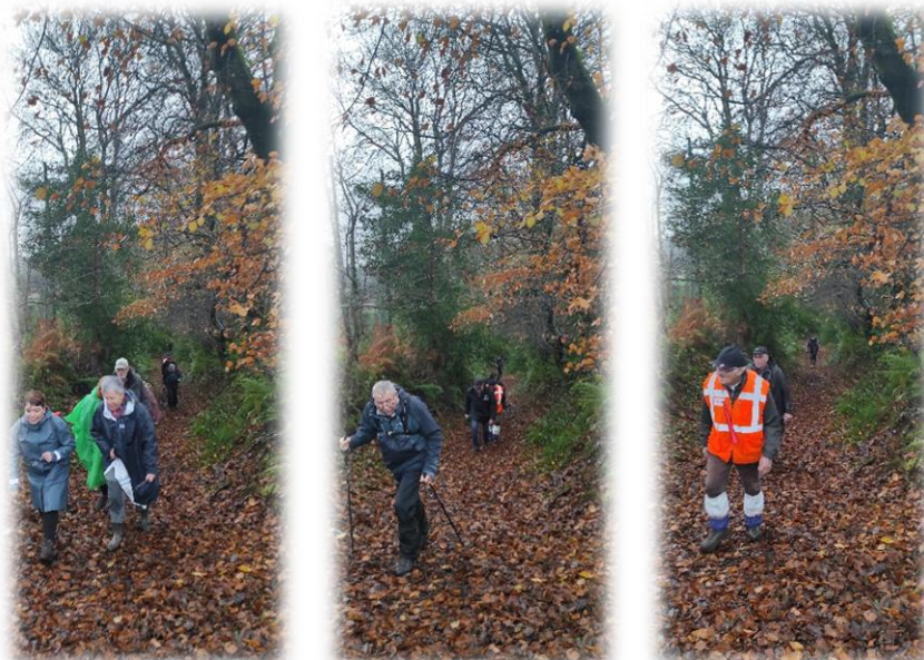
Chemin du moulin à vent. Non loin de là les vestiges de rampes de lancement V1