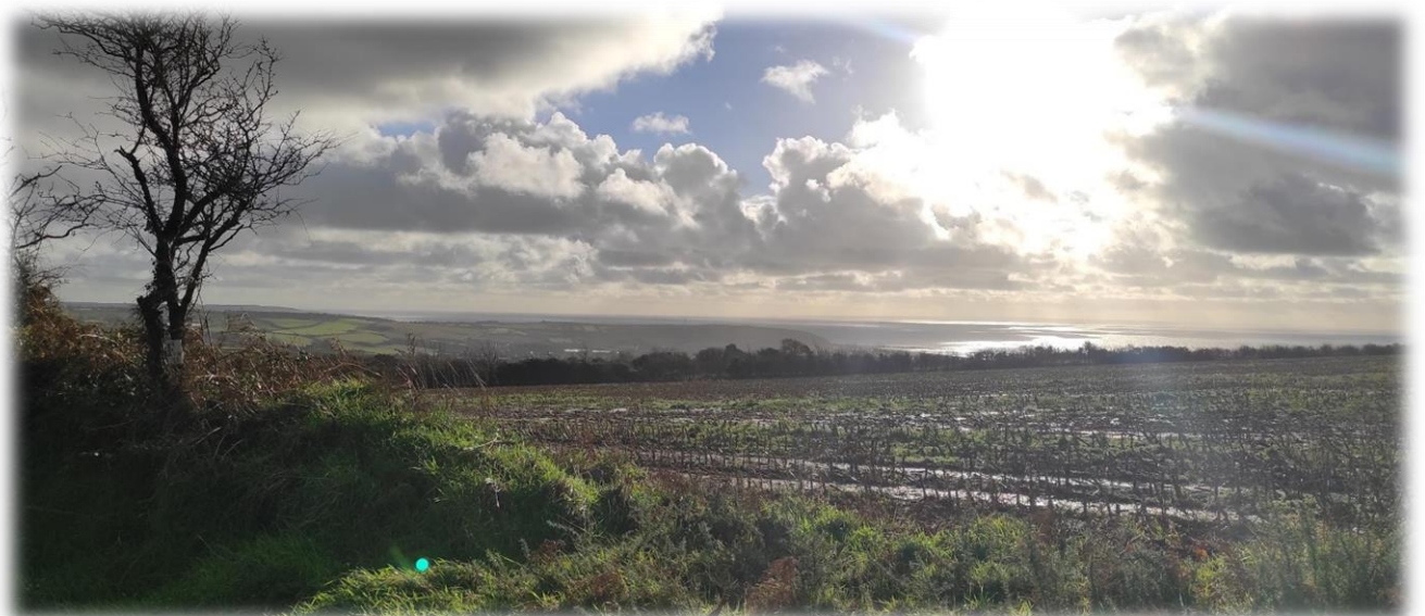
Le Cotentin est riche en paysages... même entre terre et ciel !