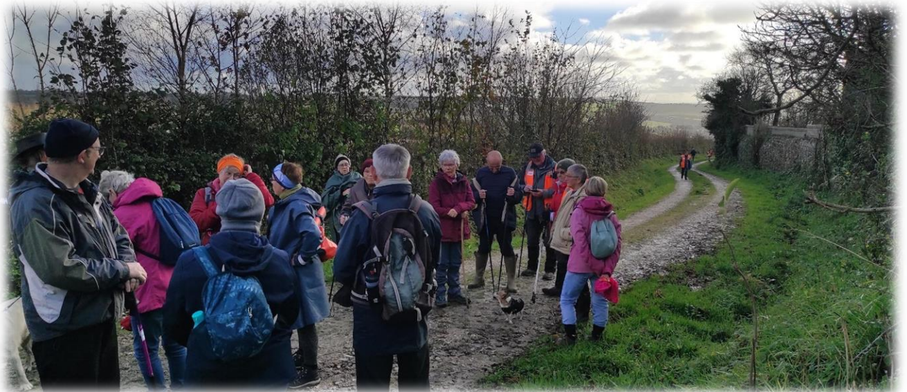
Pour ensuite grimper, grimper, jusqu'à une centaine de mètres d'altitude. Eh oui, c'est une balade entre terre et mer ... et montagne.