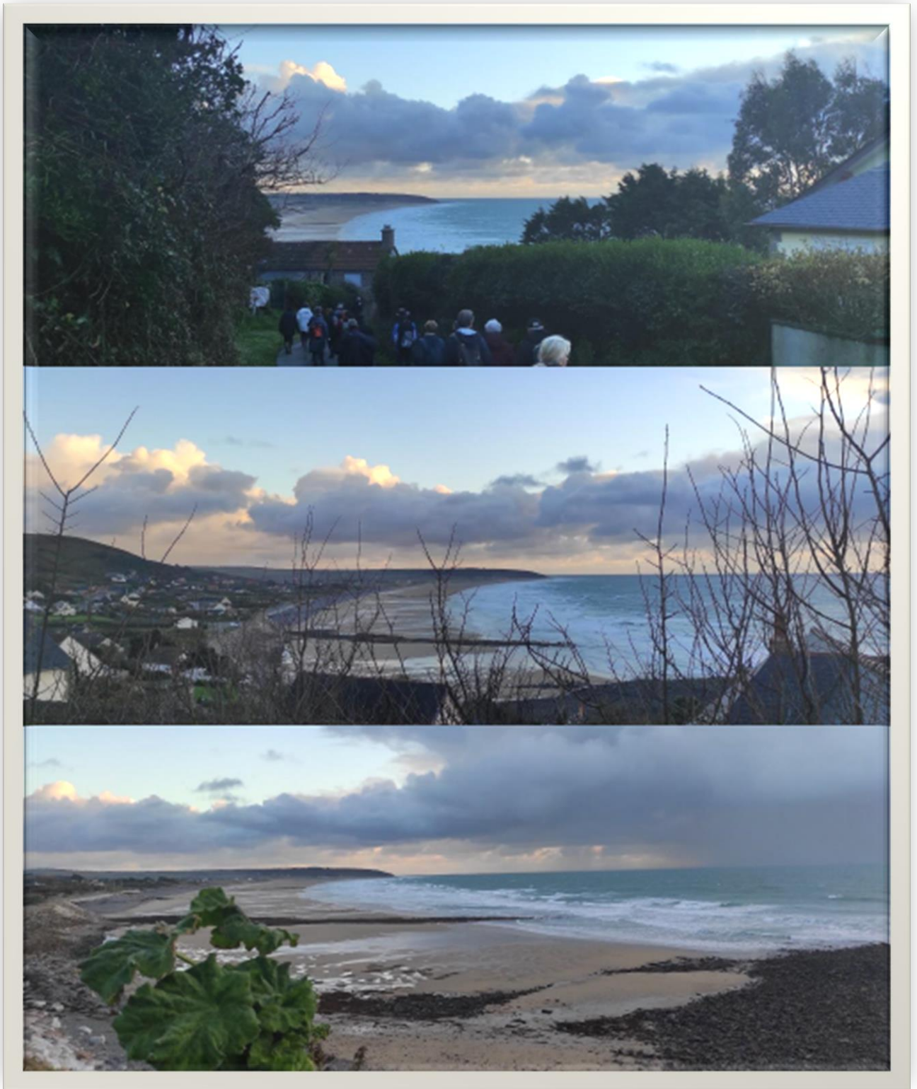
Magnifiques images du coucher de soleil au-dessus de la mer. Merci Jean-Claude