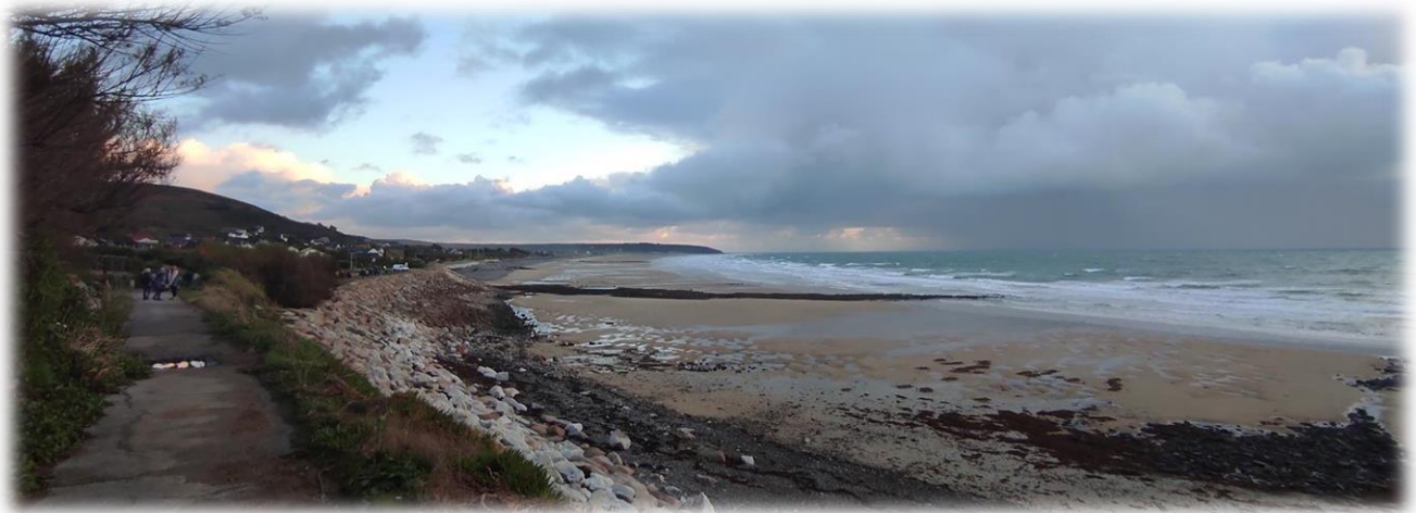
L'Anse de Scirotot