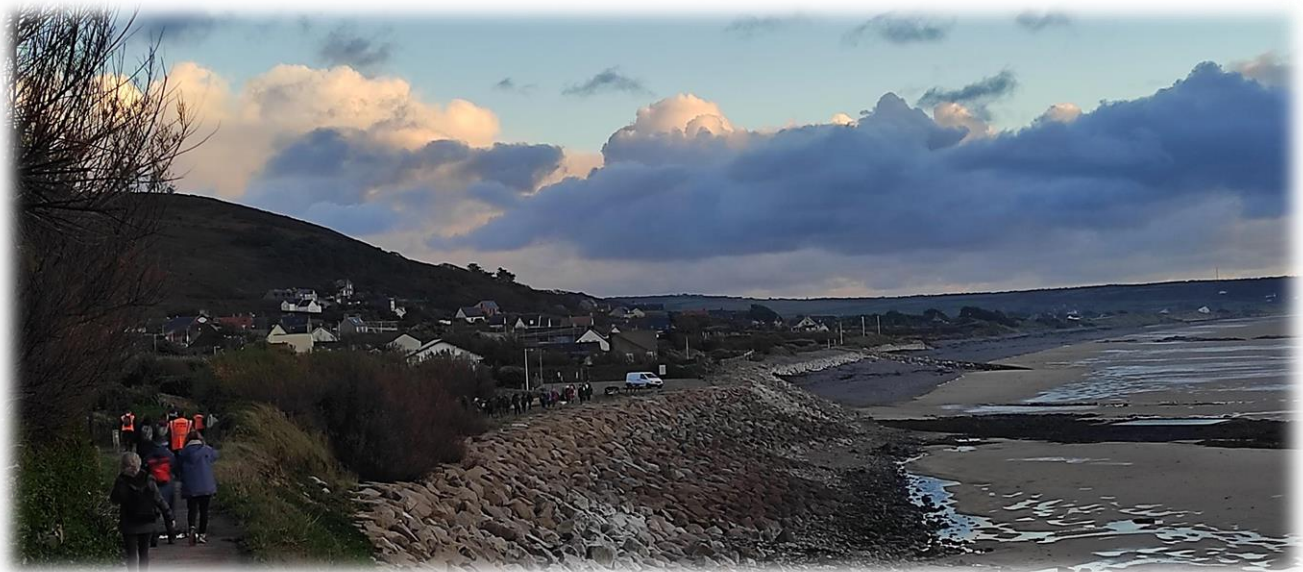
Un important cordon d'enrochement a été réalisé ici