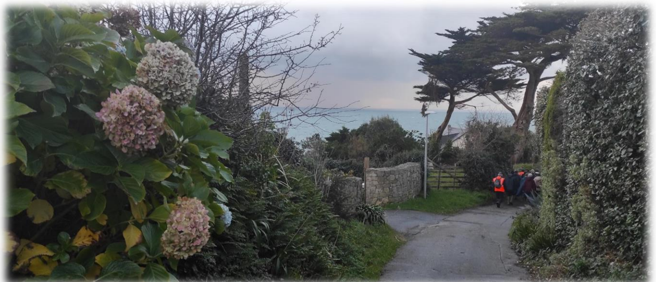
Sur le chemin du retour... l'anse de Sciotos est en vue !

Le saviez-vous ? Le granite qui est assez commun en France et notamment ici dans la Hague, est une roche réputée pour sa dureté et sa résistance. Cependant, ce granite « pourri » comme on le voit sur la photo et surtout le long de notre chemin, se désagrège et se réduit à un amas de grains, formant une sorte de sable grossier, qu'on appelle l' arène granitique ..