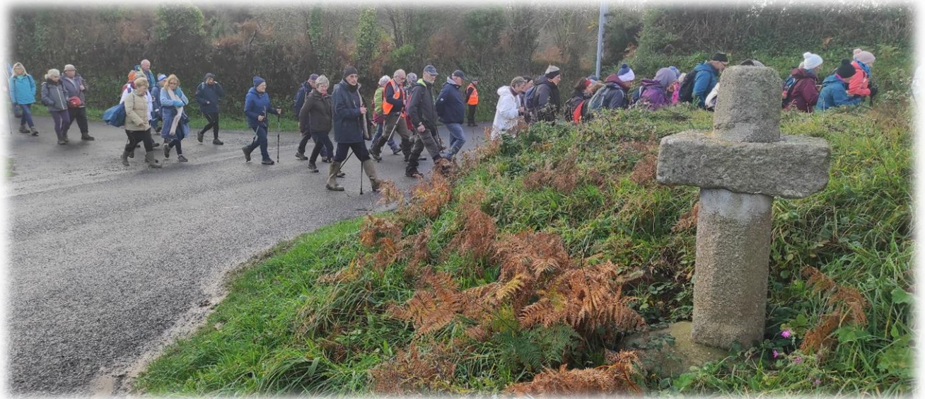
Traversée de la D265 au carrefour de la Croix Brûlée. Celle-ci aurait été retrouvée par des Scouts, en 1990.