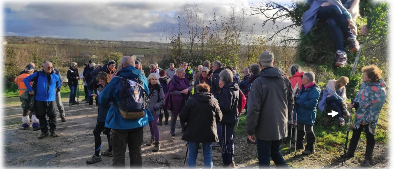
Petite pause à l'autre bout de la rue du Grand Large, intersection avec la D517

Ouille, ouille, aurai-je une ampoule au pied ?