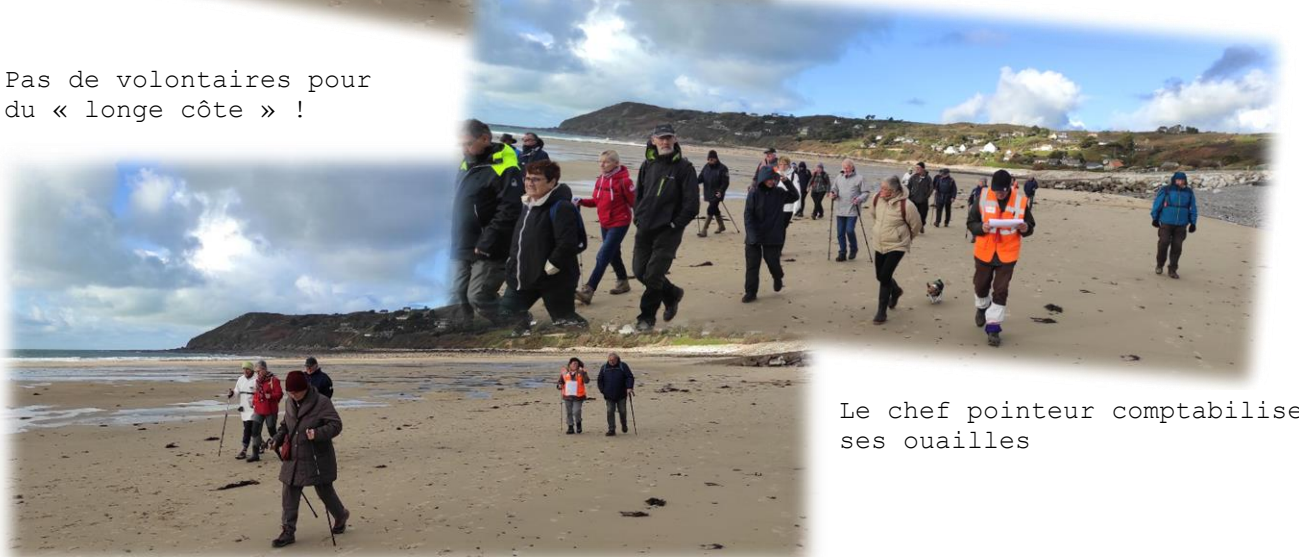
Le chef pointeur comptabilise ses ouailles