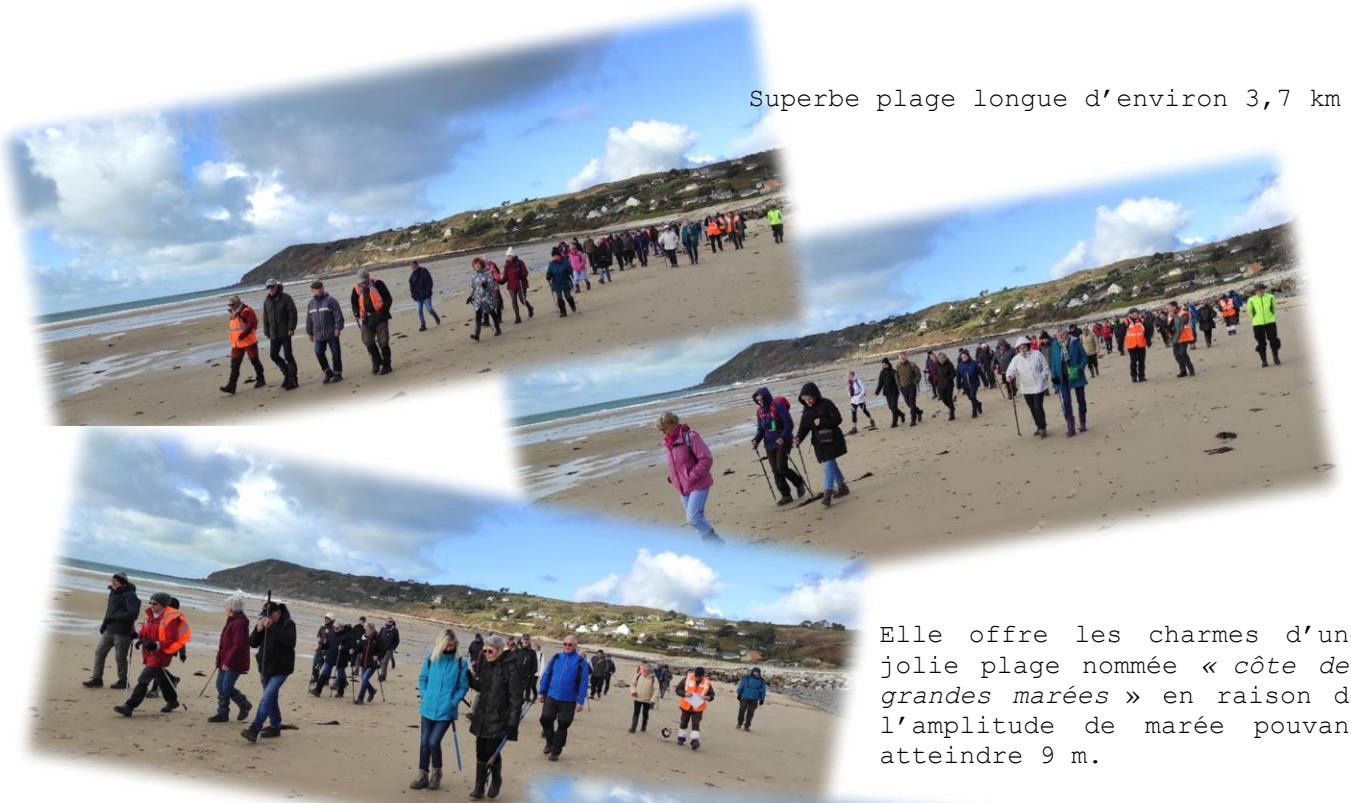
Elle offre les charmes d'une jolie plage nommée « côte des grandes marées » en raison de l'amplitude de marée pouvant atteindre 9 m.