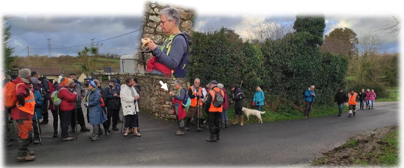
Une petite pause, tout juste le temps de se ravitailler