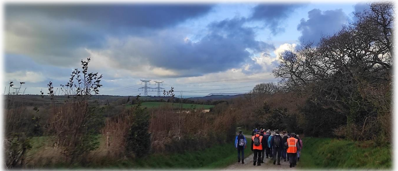
Le ciel s'assombrit un peu