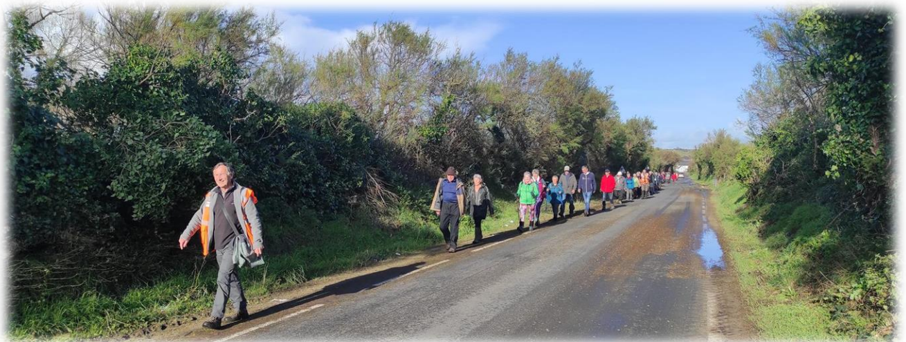
Un berger, ayant conduit ses moutons dans les mielles de Saint Jean de la Rivière, aperçut au loin la mer ... aujourd'hui bien calme. Ciaram est passé.