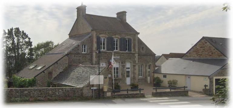
L'ancienne école est devenue la mairie