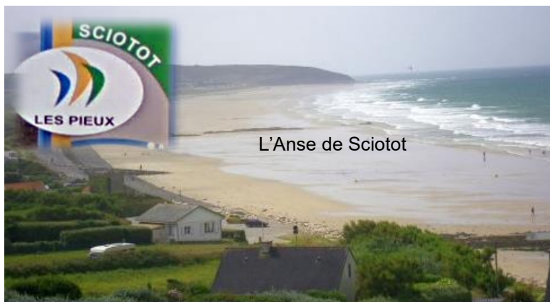
L'Anse de Sciotot

La plage de Sciotot, qui arbore le Pavillon Bleu, dispose de deux sites de