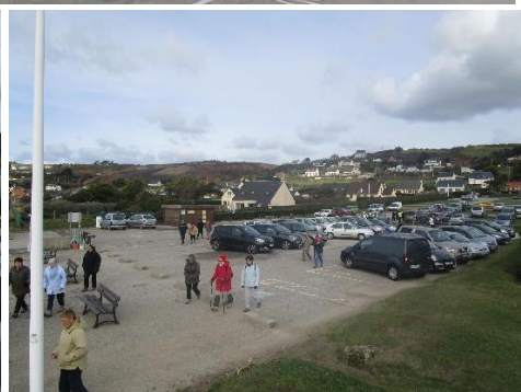
Parking de la route de Fort (chemin menant au lieu-dit Le Fortin)