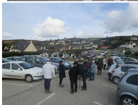
Parking devant le restaurant Le Vent de Mer