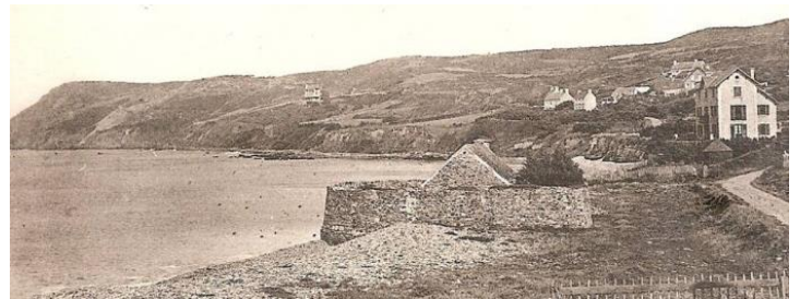
Le Fortin et le Cap de Flamanville

Les côtes du Cotentin ont, durant des siècles, connu de multiples incursions. Pendant très longtemps, les habitants du littoral n'eurent d'autre solution que de fuir, emportant le peu de ce qu'ils possédaient, lorsque des envahisseurs étaient signalés. Puis la défense s'organisa très localement et c'est sous le règne (1515-1547) de François 1 er que l'on vit créer le « guet de mer », avec des milices paroissiales.