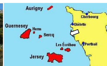
La Roche à coucou