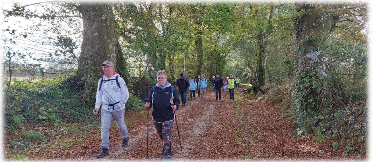
Chasse Linot longue d'au moins 700 mètres.