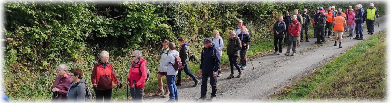
Rue des Ruettes