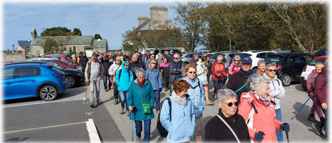
Le groupe de 81 randonneurs se met en route,