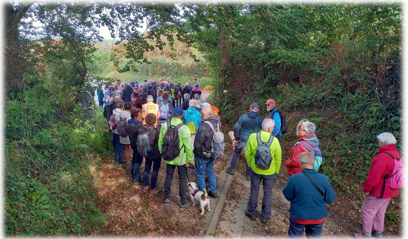
Au bout de la chasse, la rue des Haizes (D409)