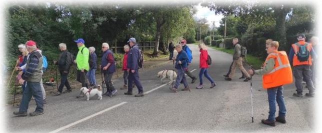
Arrivons au hameau Martelet, rue du Bel Hamelin