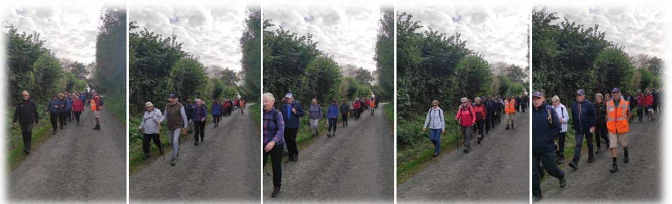
La vieille chasse (territoire d'Equedreville-Hainneville)