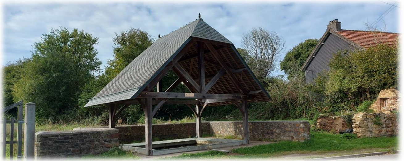
Lavoir du hameau Martinet au toit imposant