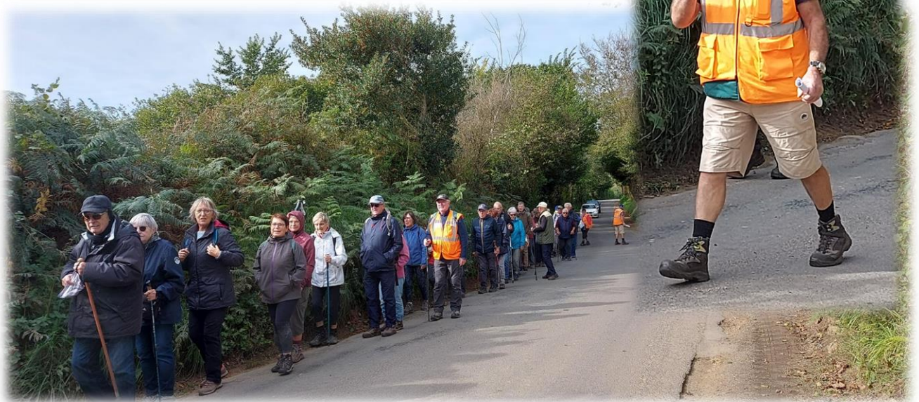
En file indienne sur la D123, sécurité oblige