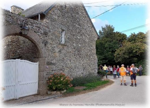
Manoir du hameau Horville (Flottemanville-Hague)