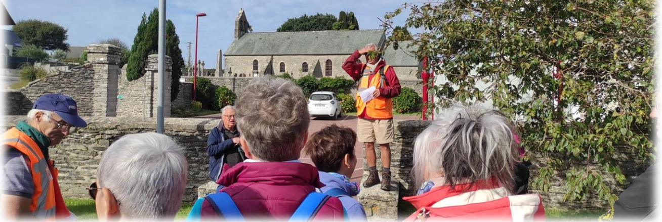
Rendez-vous parking de la mairie, non loin de l'église