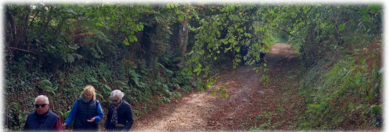
Après environ 160 mètres sur la D409E1, beau chemin à droite