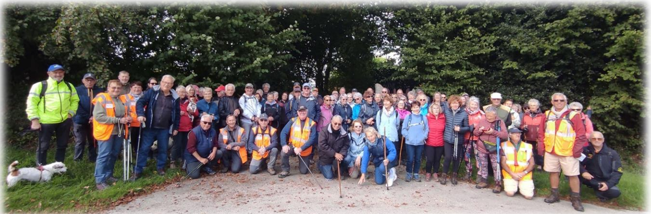
Une pause le temps de faire la photo de groupe