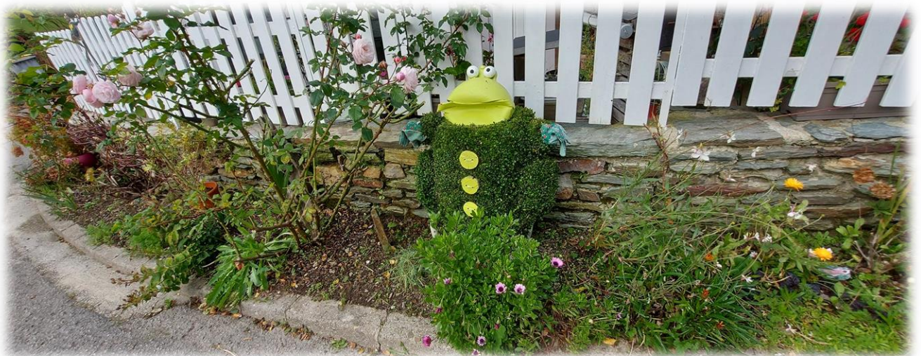
Hameau du Pilon, maison joliment décorée