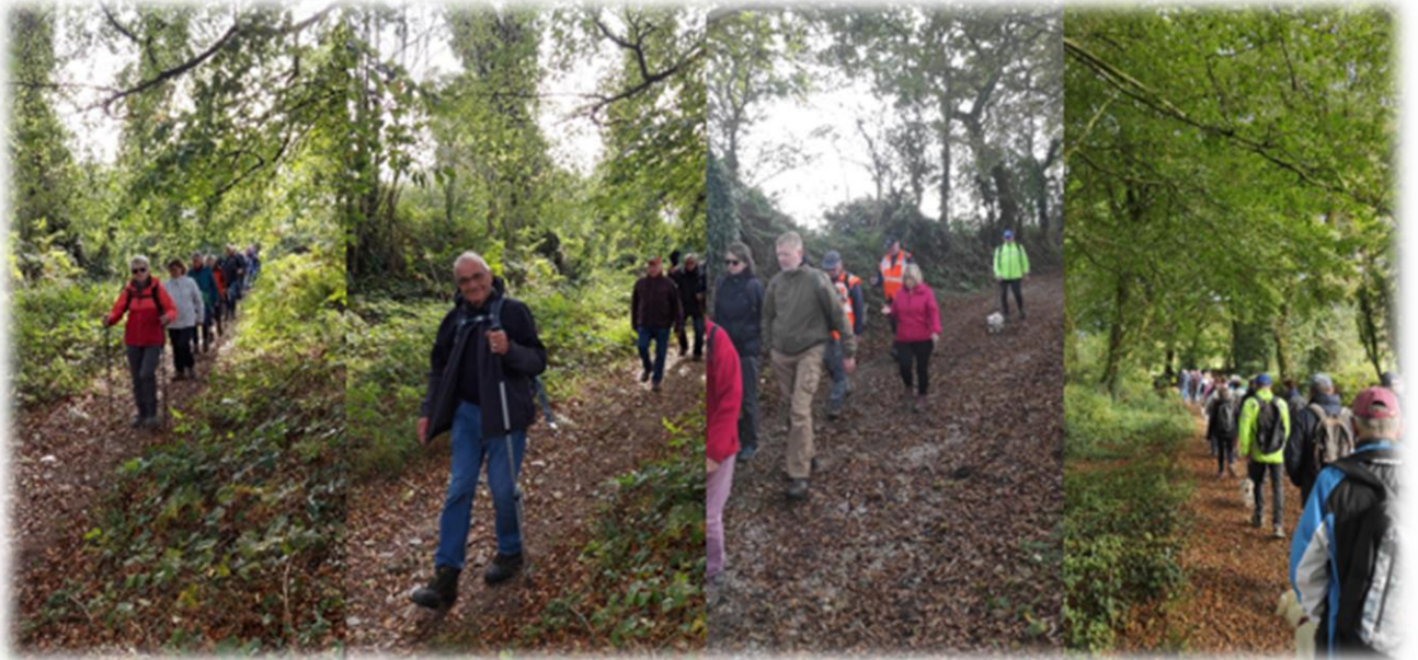
En direction du hameau Martelet