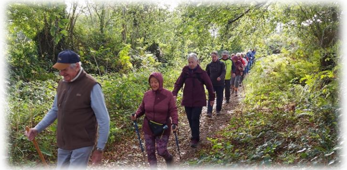
Puis un autre tout aussi verdoyant,