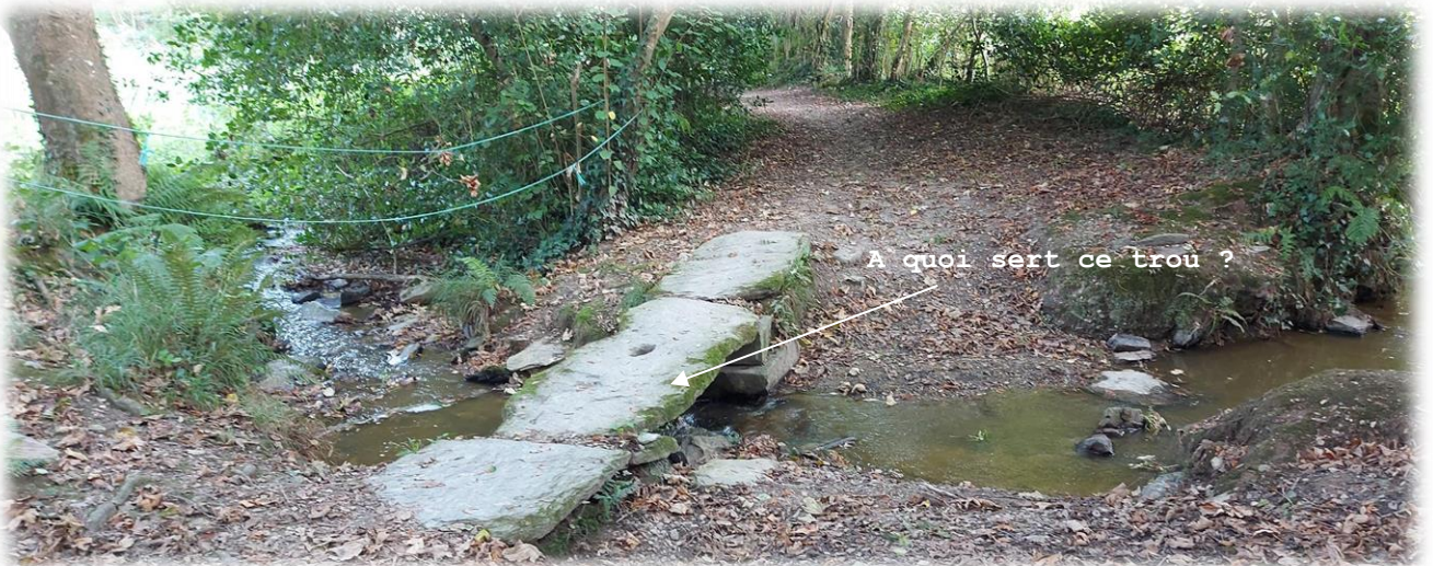
Pierres de gué sur le ruisseau du Fay qui prend sa source tout près d'ici

Une randonneuse aurait-elle perdu sa culotte ? Oh ça arrive même à certaines chanteuses, sur scène, paraît-il !