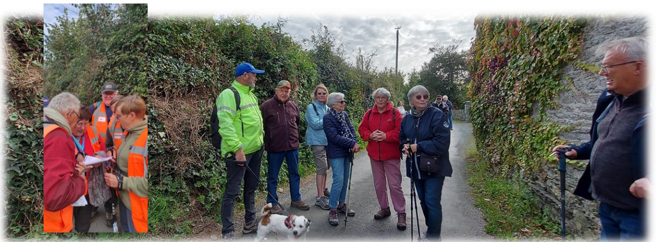
C'est là, la séparation, mais avant un dernier repérage sur plan