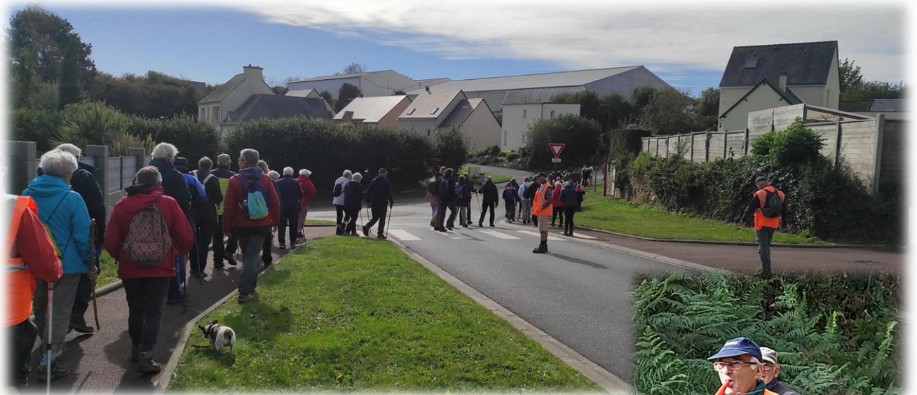
sous la bonne garde des guide et de monsieur sécurité