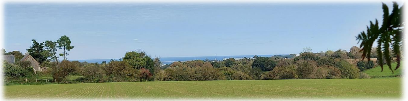
Après une petite grimpe nous sommes à 67 mètres d'altitude, vue panoramique sur la rade de Cherbourg