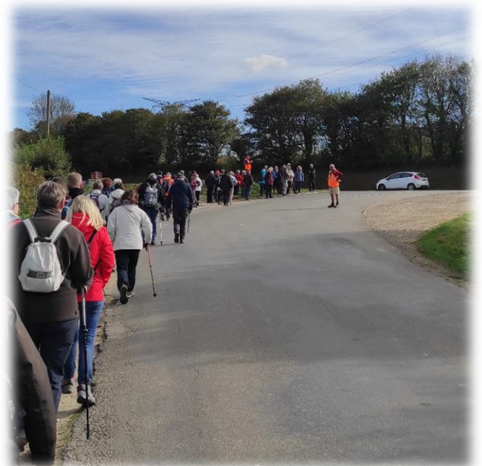
Carrefour route de l'Orangerie (point vu d'orangers dans le coin) / D64 (Héauville-Octeville) que nous n'empruntons que sur 200 mètres