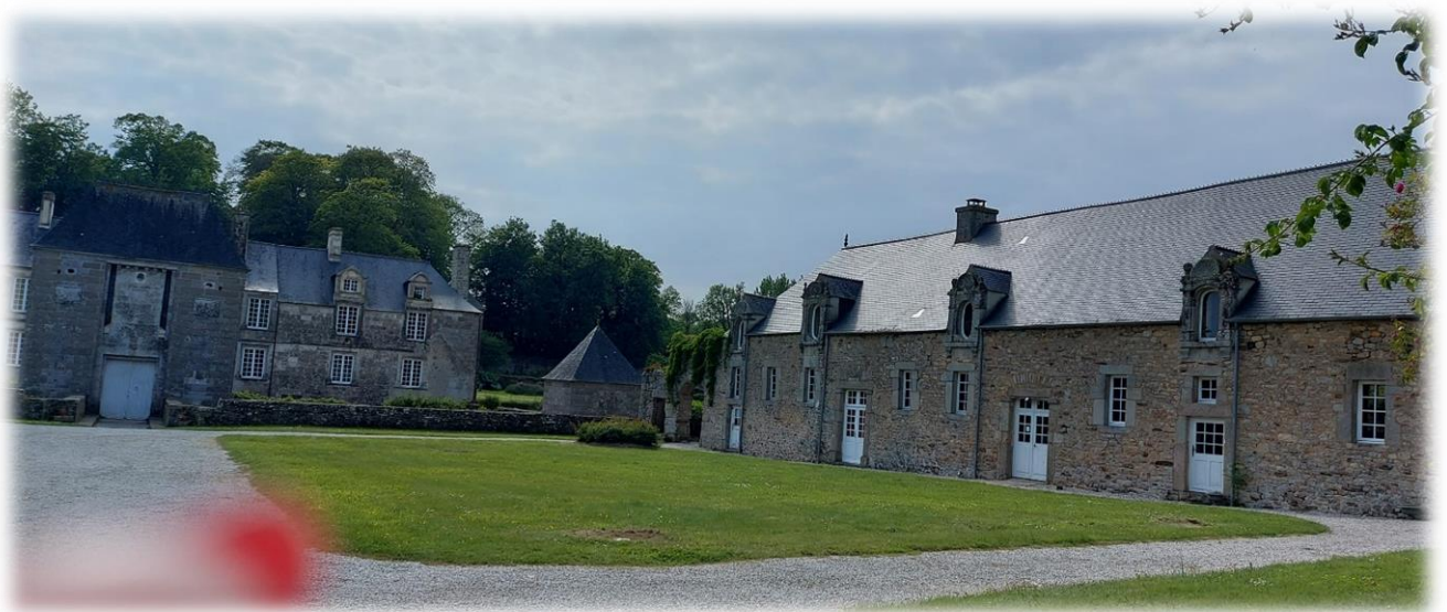
Le château de Gonneville (XV e -XVIII e )

Le château de Gonneville a remplacé un château de bois existant entre 920 et 1330 environ. Le donjon orné d'une élégante poivrière et les deux tours d'enceinte sont les seuls vestiges du château féodal construit au XV e siècle. Puis, ce sont les de Pirou qui construisirent ce château renaissance entouré de douves en eau, toujours existantes.