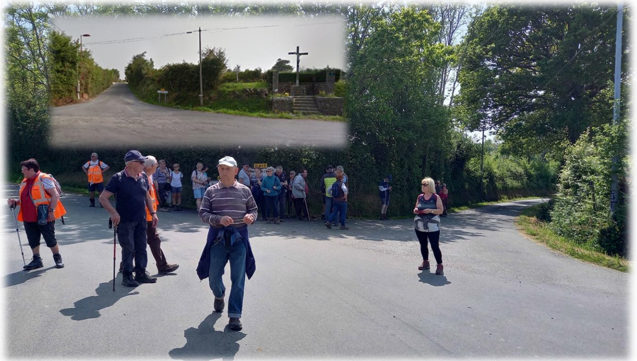
Carrefour route des Hauts Vents (D320) / route de Gonneville (D413), c'est le moment de la séparation.