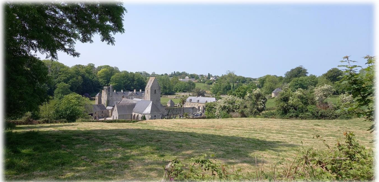
Vue panoramique sur l'église et le château