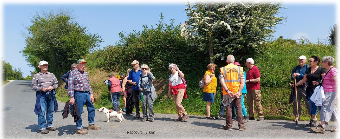
Groupe raccourci, retour direct vers Gonneville