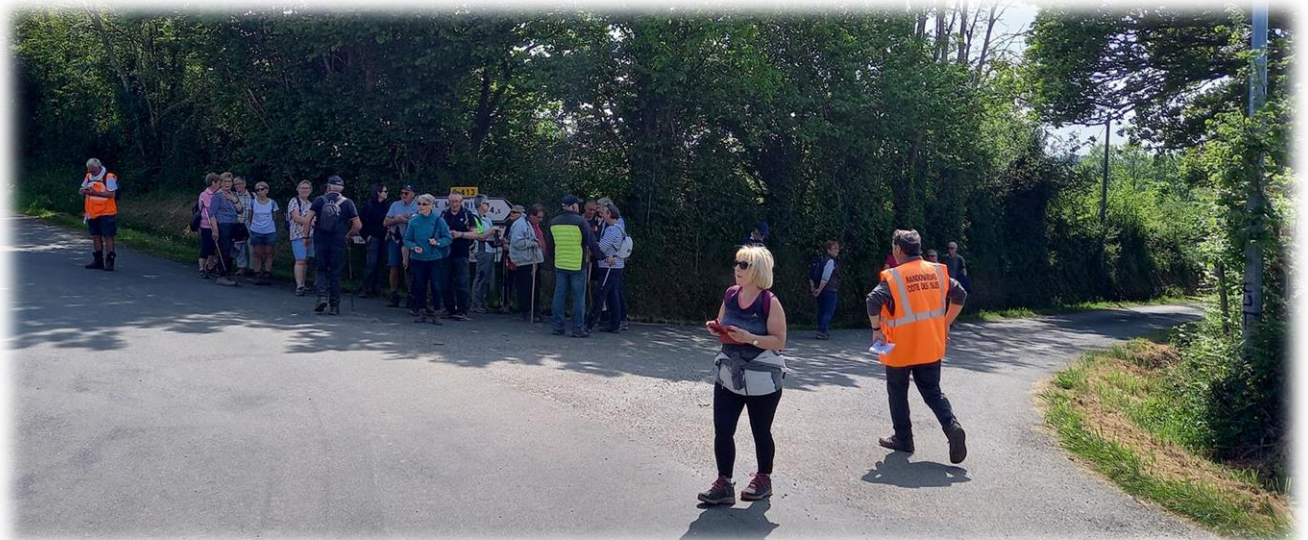
Groupe long parcours en direction hameau Pinabel