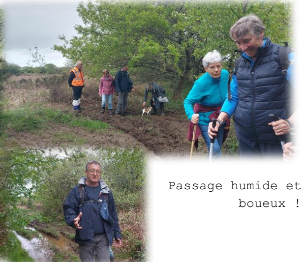
Passage humide et boueux !