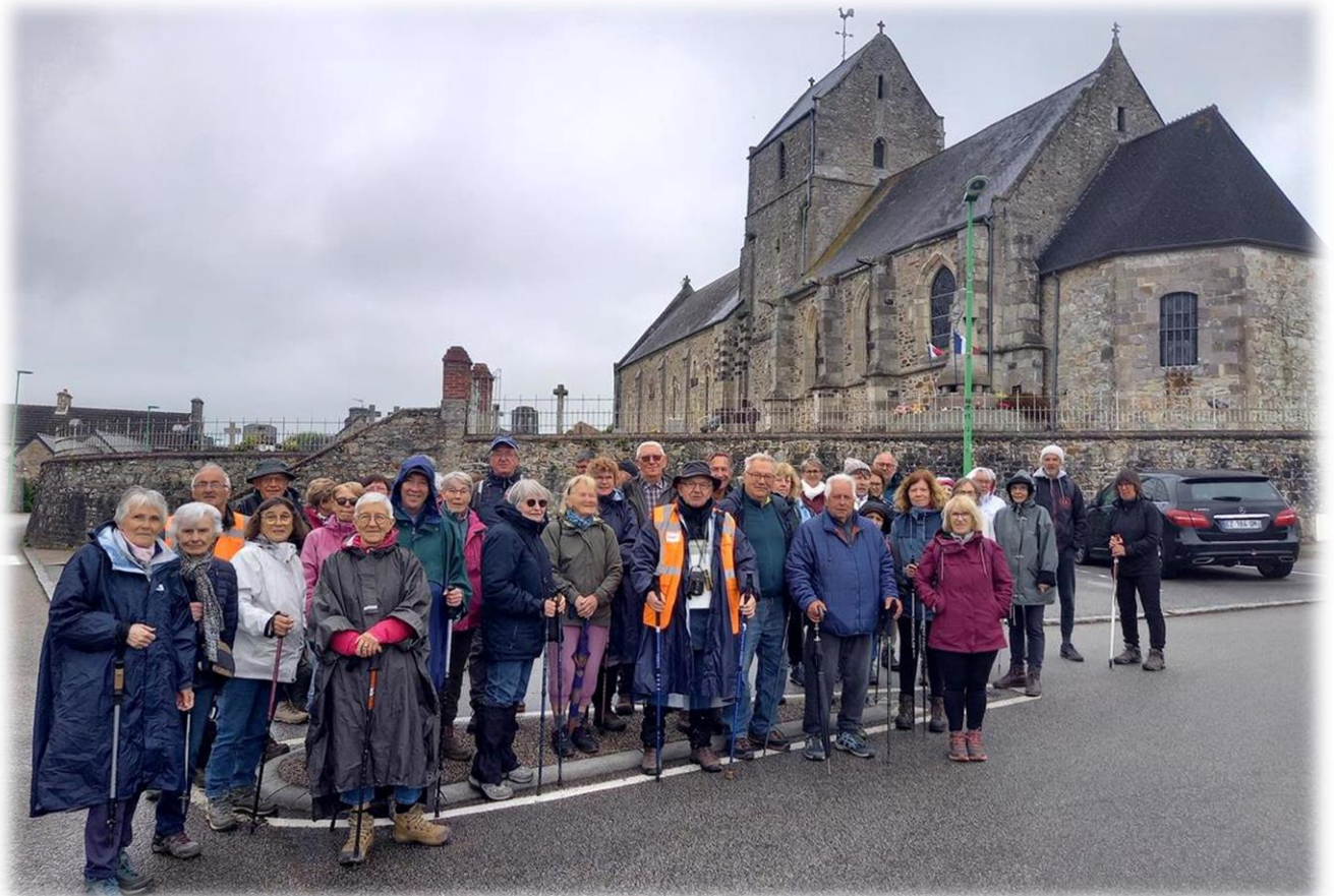
Photo de groupe devant l'église Notre-Dame (XII e -XIII e -XV e ) L'église est bâtie selon un plan allongé à vaisseau unique. Longue de huit travées, elle se termine par un chevet plat à mur mignon dans lequel est axée une sacristie polygonale. La tour clocher est placée au niveau de la cinquième travée.