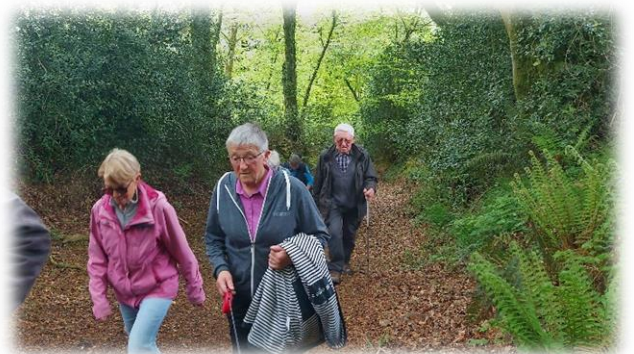
Une bonne grimpe le long du bois de Néretz, point culminant à 83m tout de même.