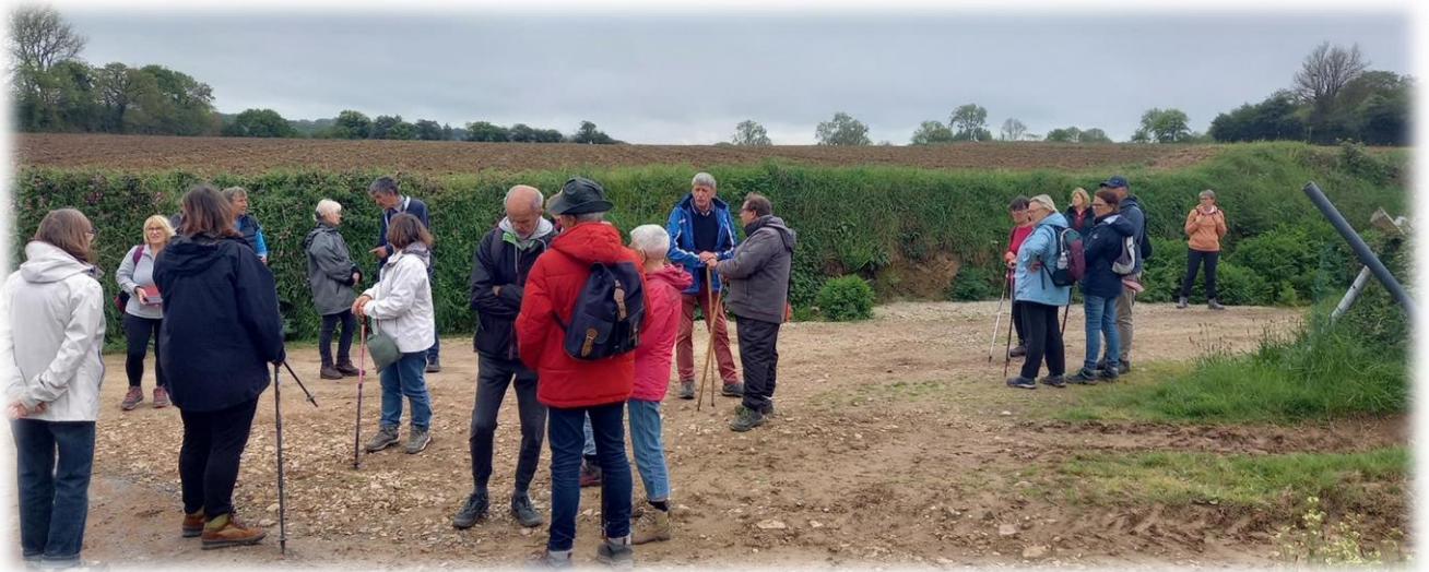
C'est le moment de la séparation