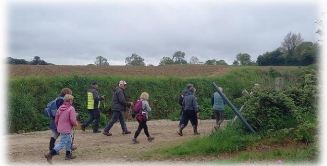
Le groupe long parcours