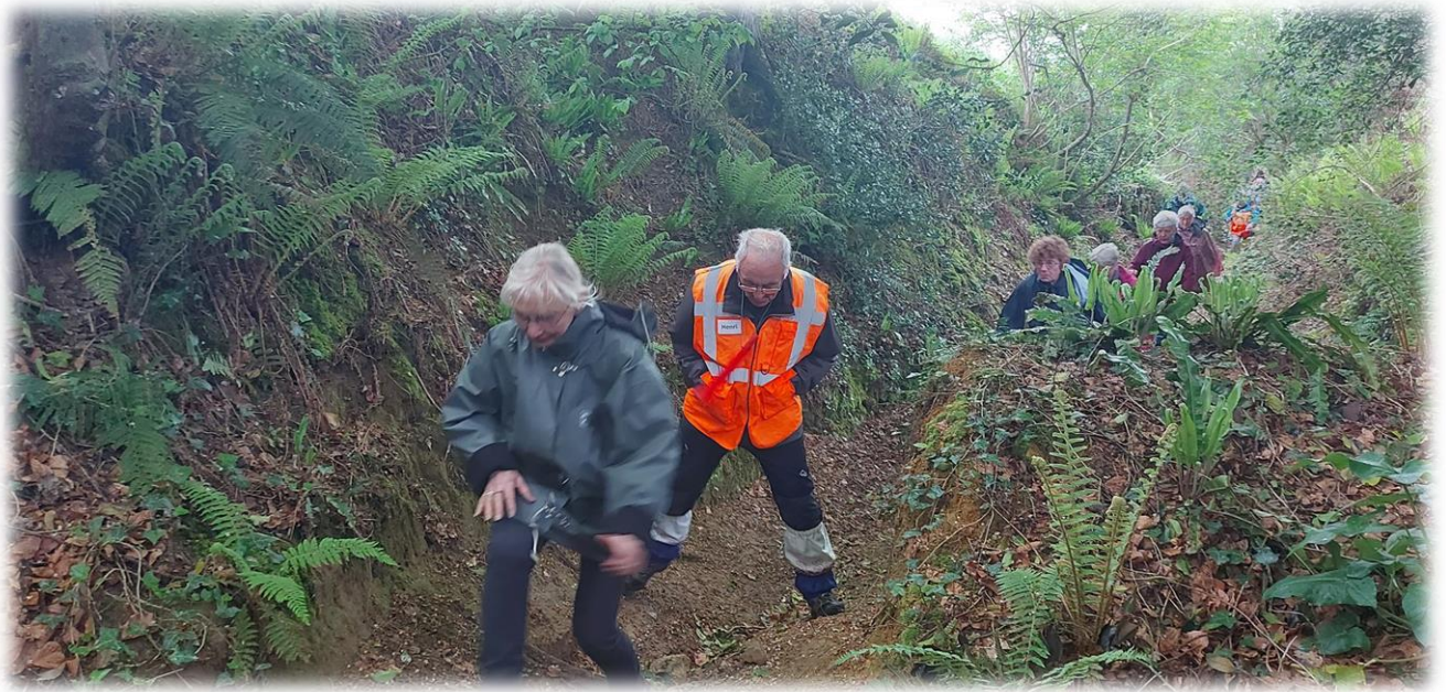
Chemin encaissé, quelque peu difficile à gravir