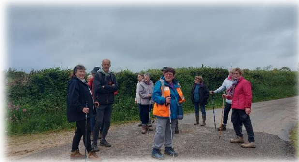
Le petit groupe raccourci