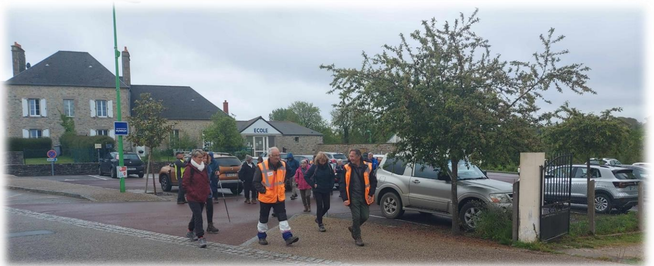
C'est parti, suivez le guide