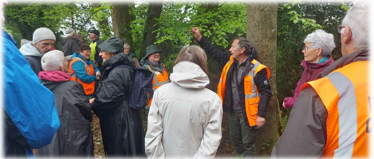
En haut duquel, quelques commentaires, et quelques blagues bien sûr !