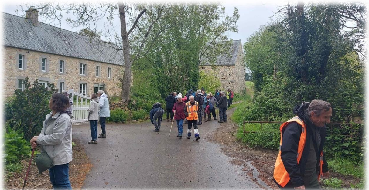
Le petit Pré, belle bâtisse avec toiture en pierre de schiste. Le linteau de porte est daté de 1823, et autre inscription gravée « LOUISE LAYEE » ???