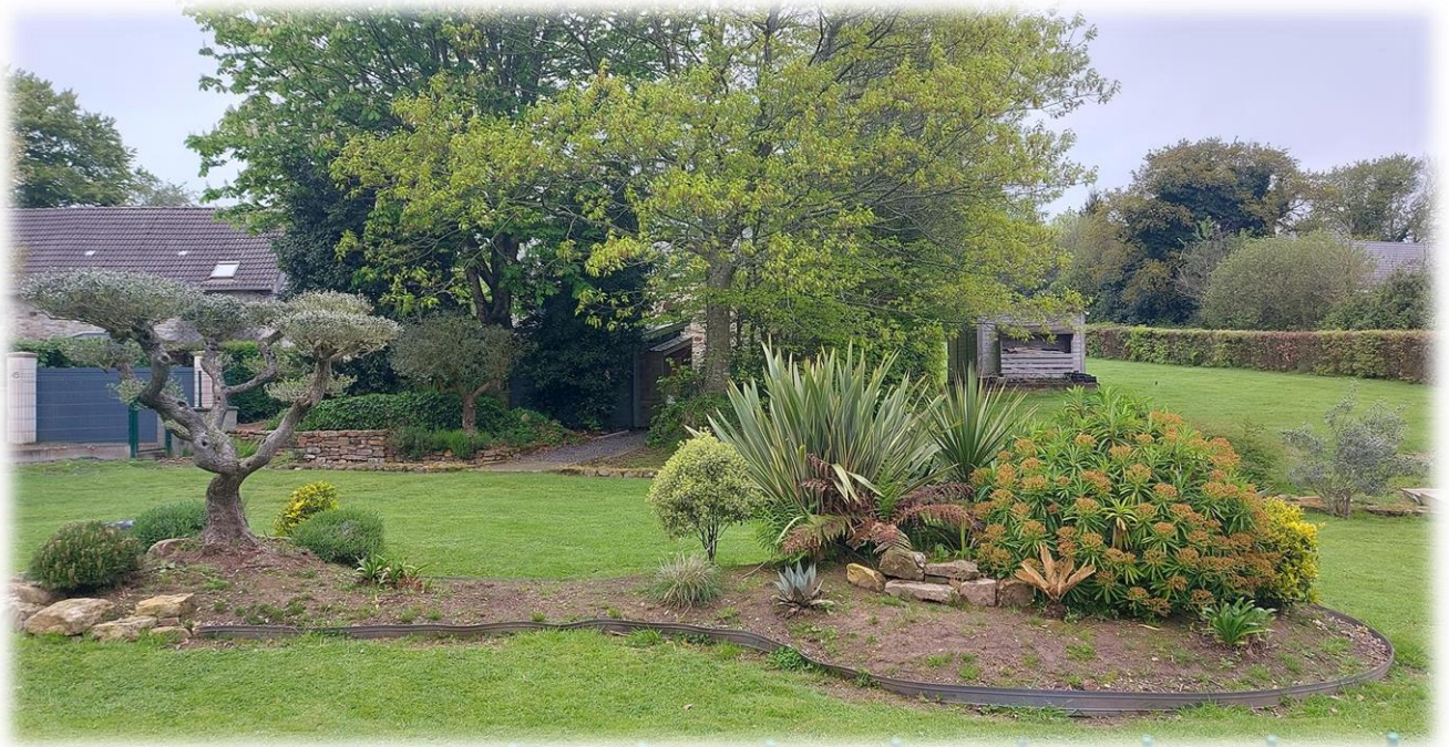
Jardin des plantes de Teurthéville-Hague !!!