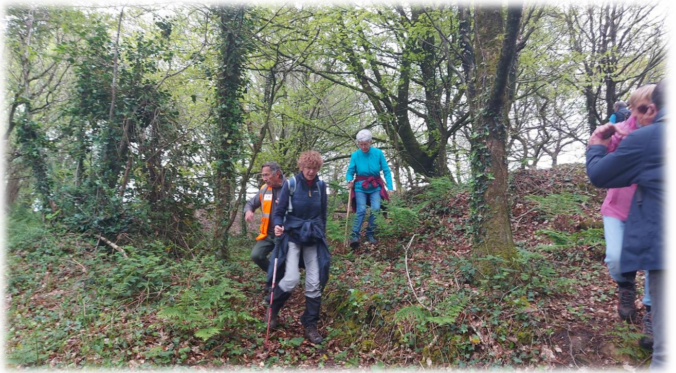
Terrain accidenté, et galanterie !