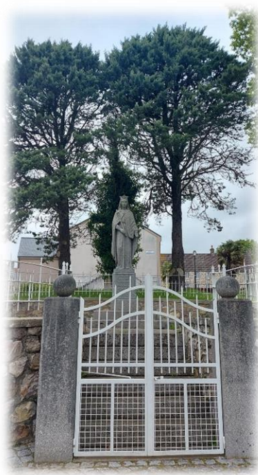
No comment !