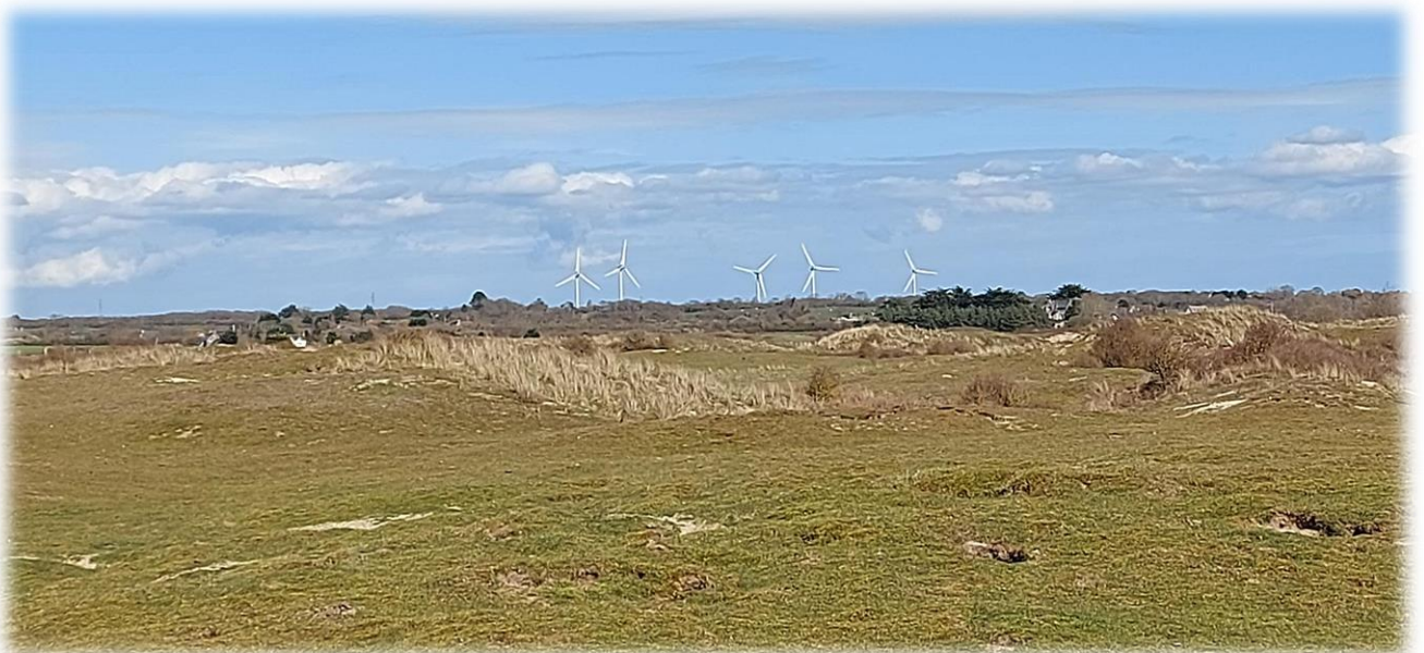
Paysage dunaire avec les éoliennes (x5) de Baudreville en toile de fond