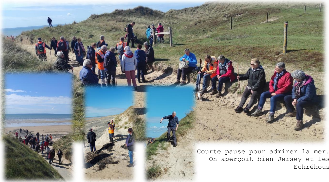
Courte pause pour admirer la mer. On aperçoit bien Jersey et les Echréous