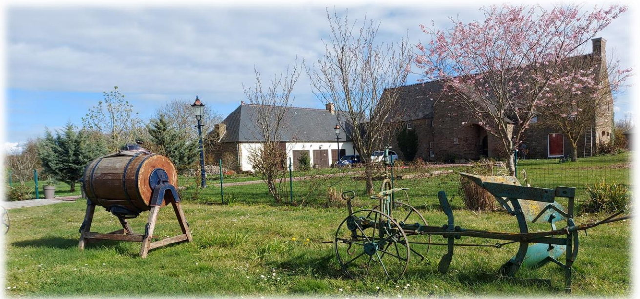
Rue de Surville, une maison avec une avancée particulière en façade. Une baratte à beurre ancienne et un brabant