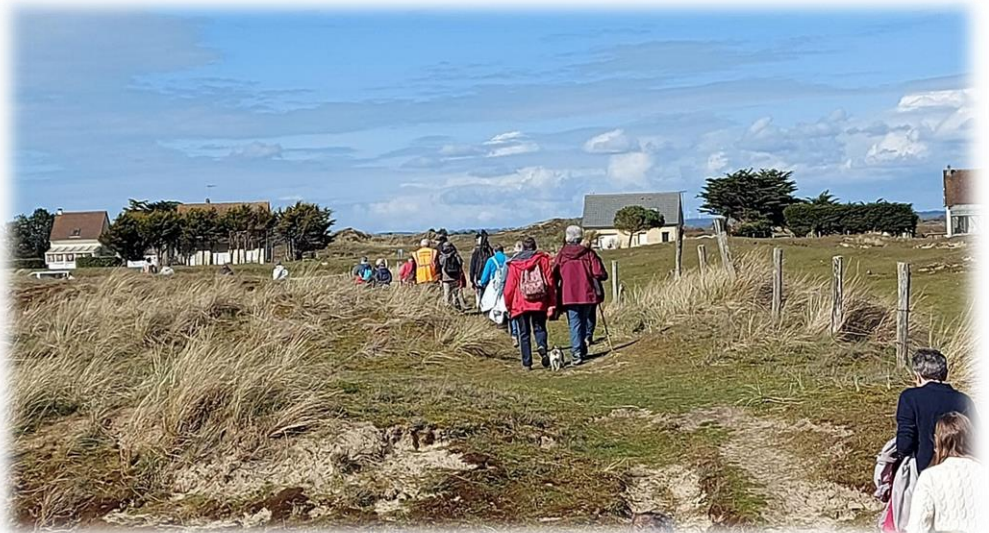
Sur le chemin de randonnée GR223