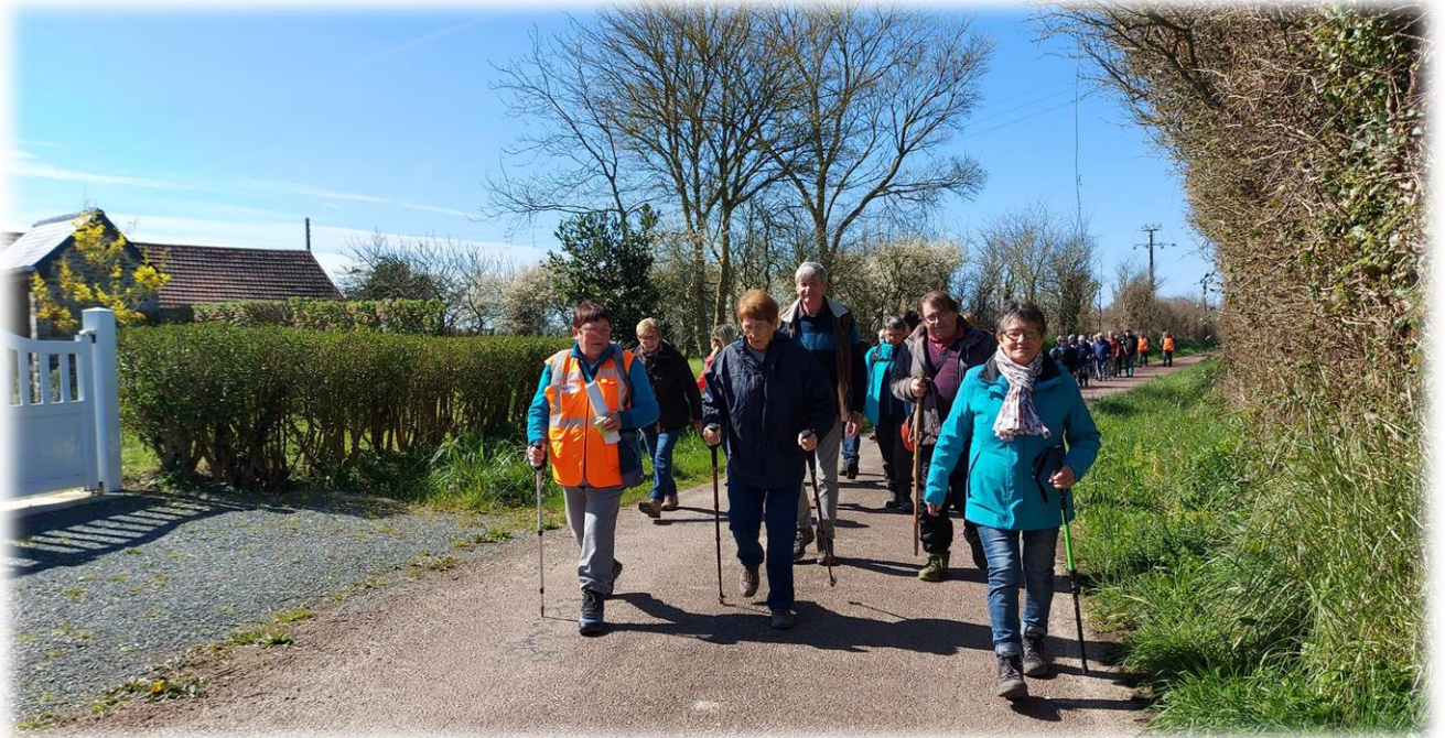
D'un pas décidé, c'est parti pour une jolie randonnée ensoleillée.