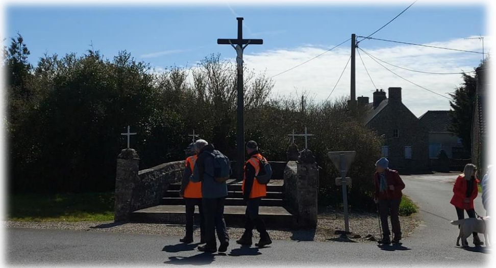
Le puits de la Surelière et le calvaire de la Surelière érigé à la place d'un ancien calvaire détruit lors de la tempête de 1987.