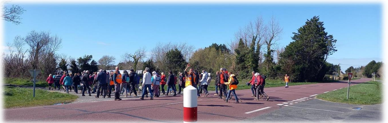
Traversée de la D650 (route touristique)