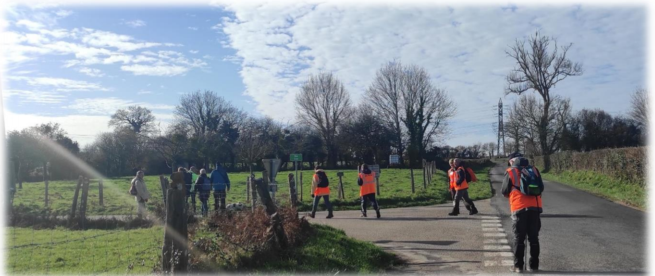
Un bel après-midi en perspective avec un ciel un peu moutonneux