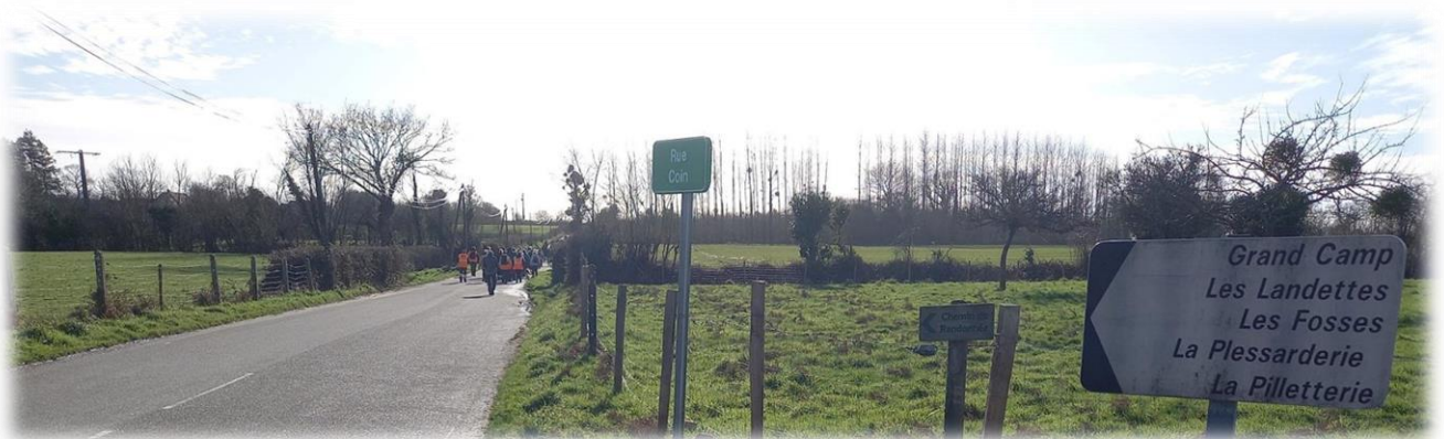
Direction Les Landettes