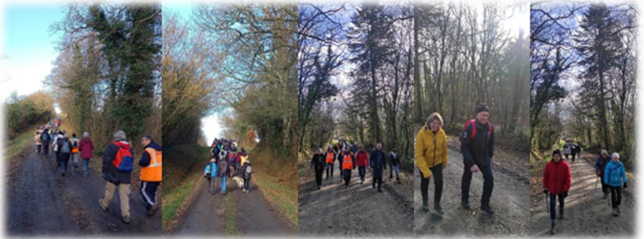
Grimpette de la Trappisterie, dure, dure !