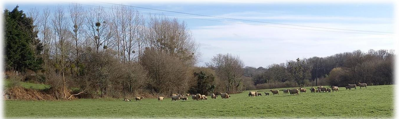
Voilà un beau troupeau de moutons et nombreux agneaux ... pascal ?