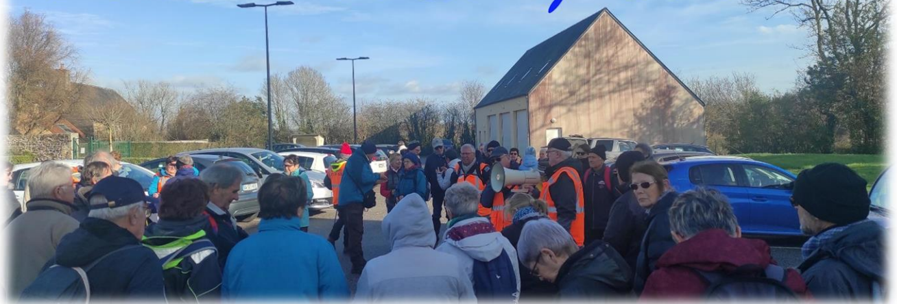
Rendez-vous grand parking derrière la salle polyvalente