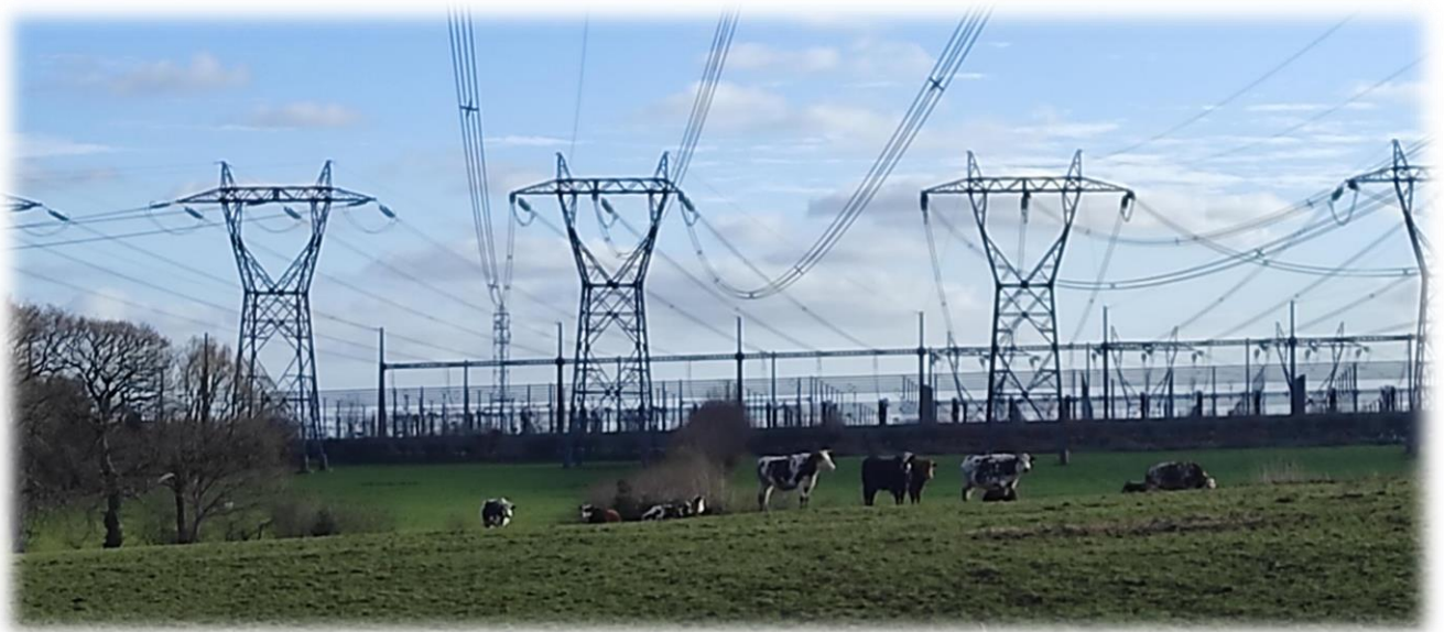
Poste RTE de MENUËL

C'est à partir de là que l'électricité produite par la centrale nucléaire de Flamanville est distribuée dans le réseau français, vers les postes de Tollevast, de Tourbe Caen, de Domloup (Rennes), et d'Oulon (Laval). Une partie de l'électricité produite par les futurs parcs éoliens Centre Manche 1 & 2 transitera par ce poste de Menuël.