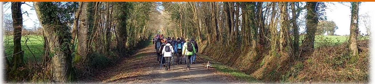
En haut du chemin, photo de famille avant la séparation