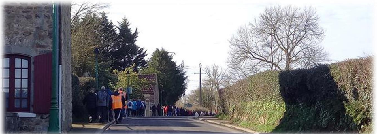
C'est parti !