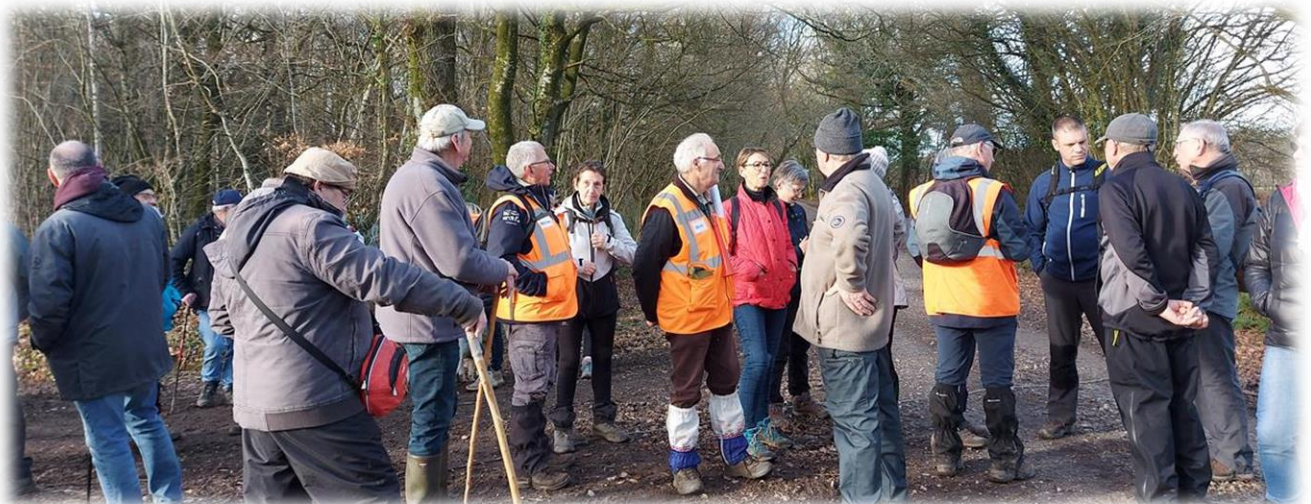
Une dernière pause, histoire de bavarder un peu

Route Collins à la mémoire du Sergent U.S. Willie L. Collins du 480th Port Battalion, tué au combat le 6 juin 1944. Il repose au cimetière de Colleville-sur-Mer.