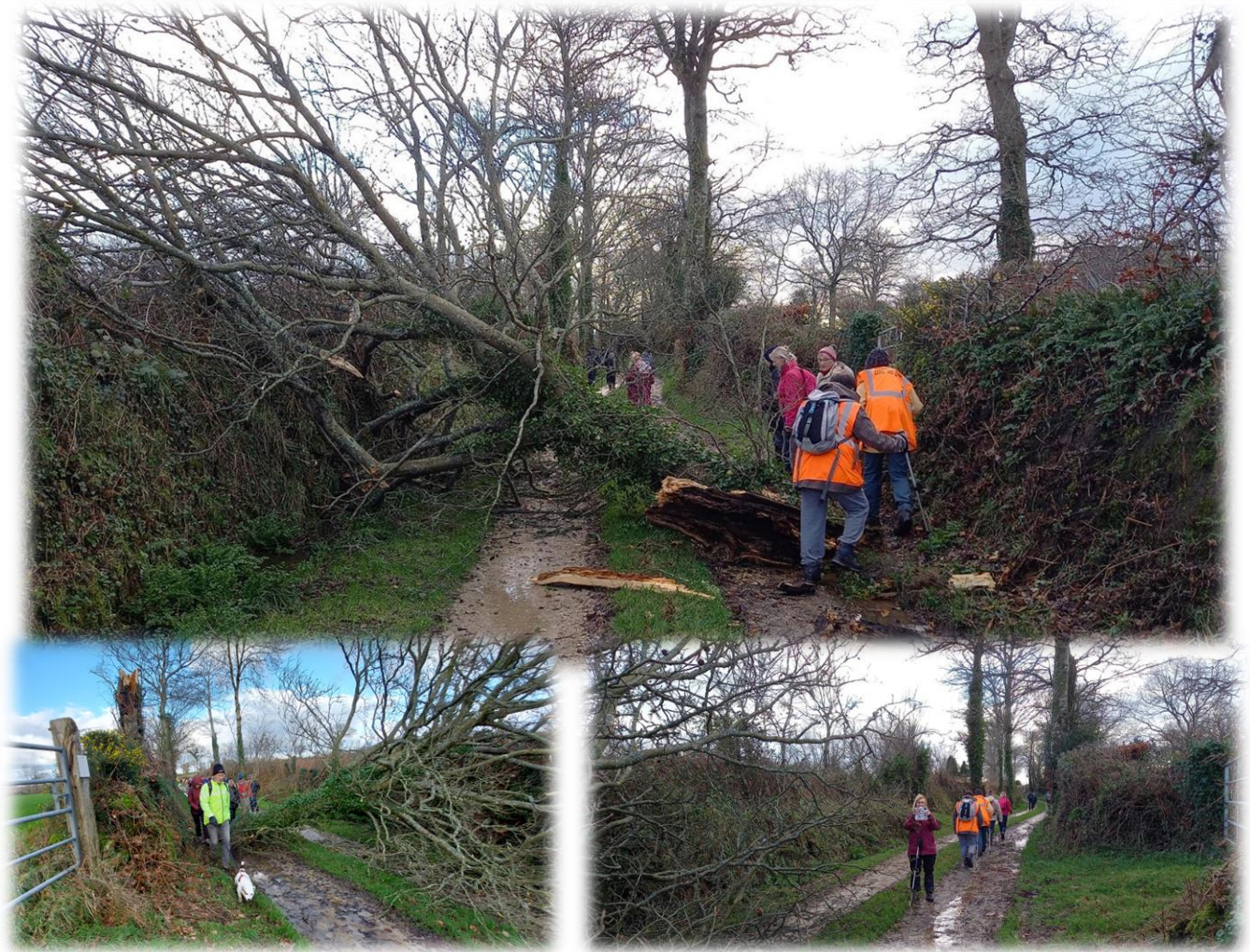
Un second arbre en travers du chemin, celui-ci était bien malade