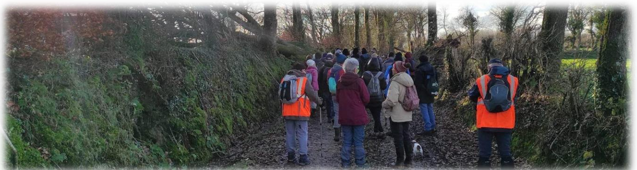
Tiens tiens, v'la un bouchon !