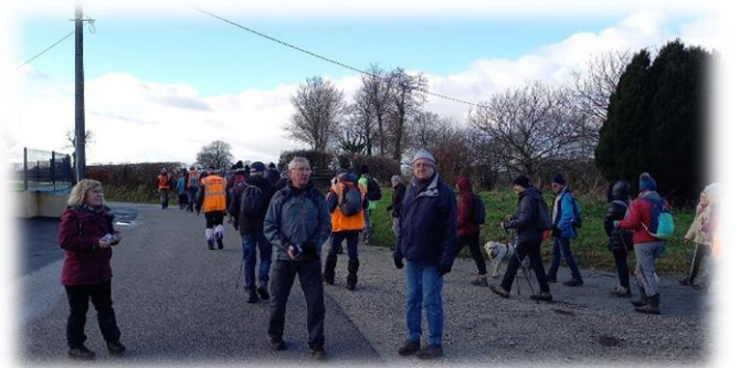
Une fois n'est pas coutume, seulement une douzaine pour le raccourci.