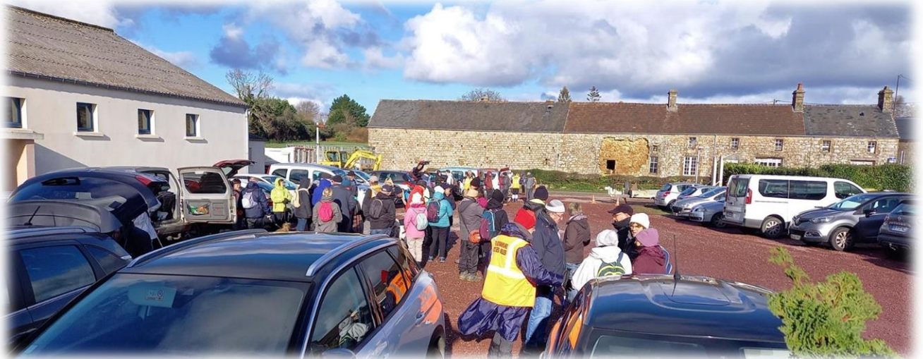
Après la tempête « Gérard » le calme est revenu et la vigilance orange levée