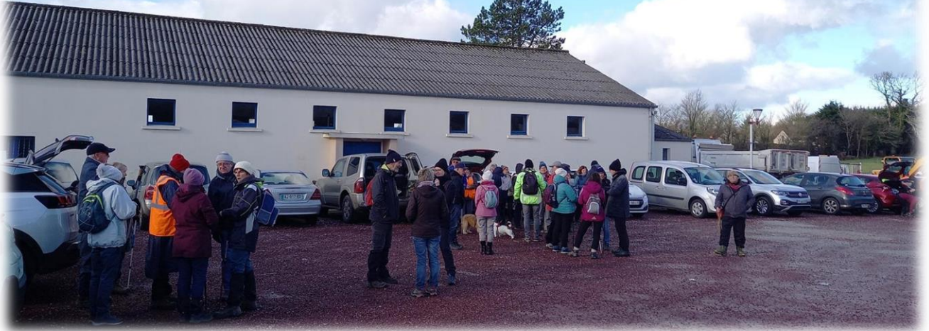
Rendez-vous parking de la salle polyvalente et mairie