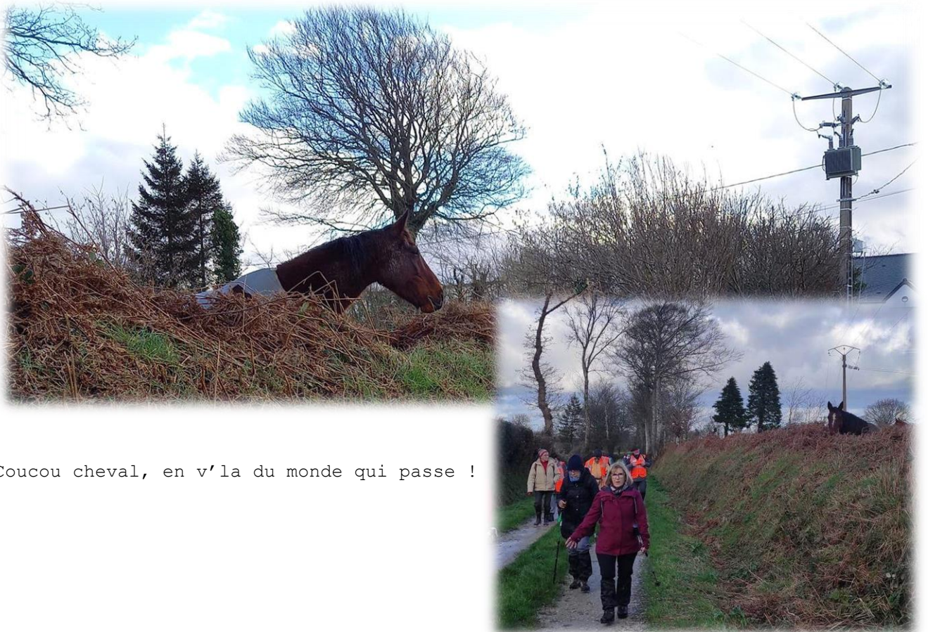
Coucou cheval, en v'la du monde qui passe !