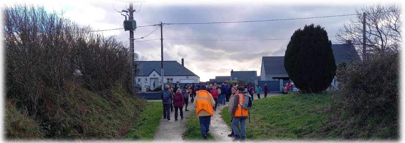
Hameau la Valette, un secteur de Quettetot qui s'est bien développé ces dernières années en périphérie nord de la commune.