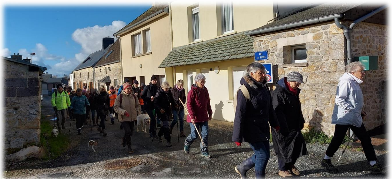
Pas de discours, il fait trop froid, vite vite réchauffons nous