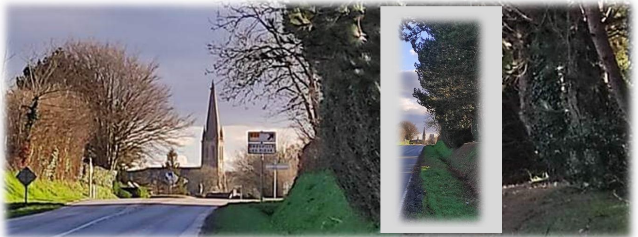
Traversée de la D900 avec au loin le clocher de Quettetot ... comme s'il était planté en plein milieu de la route.